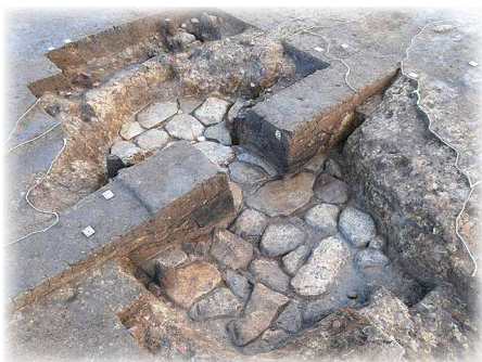
底面が揃えられた石敷き

説明会は例年12月に行っています。詳しくは、本紙面やホームページに掲載予定です。