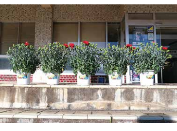
市役所に届けられた真壁高校生が育てたカーネーション

真壁高校 から、農業科草花コースの2・3年生が育てたカーネーションが寄贈され、市役所の各庁舎に飾られました。