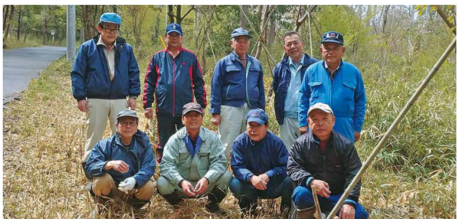
羽鳥地区谷津田とホテルを守る会の皆さん

里山の保全は、美しい山桜の咲く景観づくりのためだけでなく、自然資源や生物多様性の保全など私たちの暮らしを守ることもつながります。