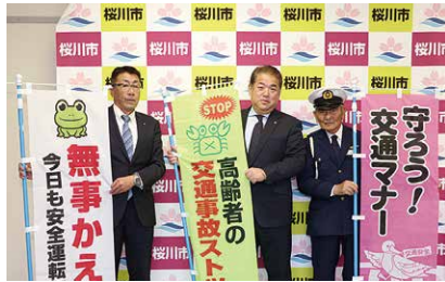
大塚市長にのぼり旗を寄贈する 各団体の皆さん

桜川地区交通安全協会・桜川地区安全運転管理者協議会・桜川市交通対策協議会から、交通安全の啓発に役立ててほしいと、のぼり旗の寄贈がありました。