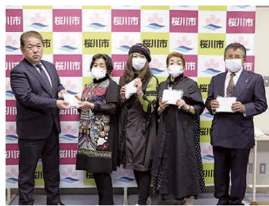
大塚市長に手作り布マスクを手渡すカラオケハウス愛の皆さん

市内に本社のある繊維メーカーから、市内の小・中・義務教育学校の児童生徒のために役立ててほしいと、同社で製作したマスク2万枚の寄贈がありました。