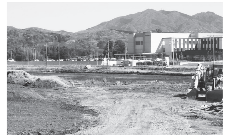
桜川・筑西IC周辺地区開発（調整池整備工事）

令和2年度予算案全体に対して、市に説明を求めました。 その中から、主な質疑を掲載します。