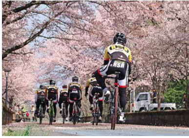
ナショナルサイクルルートに認定された「つくば霞ヶ浦りんりんロード」