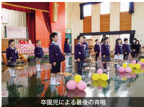
卒園児による最後の斉唱

まかべ幼稚園で、第43回卒園式と閉園式が行われました。閉園式では、5,250名の卒園生を送り出した43年間の長い歴史を振り返った式辞が述べられ、最後の卒園児による園歌が披露されました。式典の最後には、園児から「まかべ幼稚園、ありがと〜」の言葉とともに、園旗が大塚市長に返納され、出席者全員で園に別れを告げました。