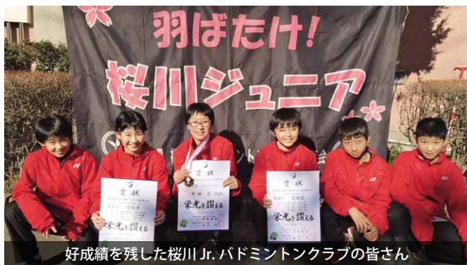
好成績を残した桜川 Jr. バドミントンクラブの皆さん