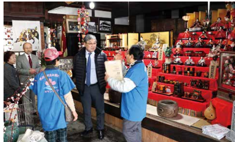
街並み案内ボランティアから説明を受ける大使(右から2番目)

文化交流について意見を交わしました。 その後、雨引観音に移動し、河津桜の鑑賞や本堂のお参りなど日本文化に触れました。さらに、真壁地区を訪れ、街並み案内ボランティアの方々の案内で、伊勢屋旅館や潮田家のお雛様、酒蔵などを巡り、重要伝統的建造物群保存地区に選定された町並みを楽しみました。