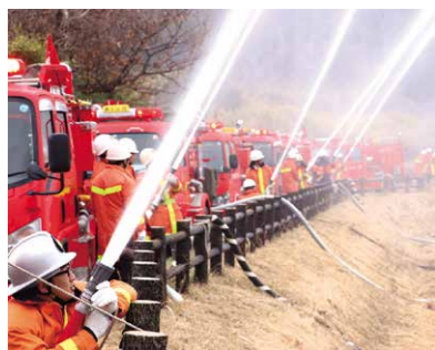
市民の安全を守る市消防団による出初式

さらに「教育支援センター」を活用した教育相談の充実を図り、不登校・ひきこもり問題の解消に努めてまいります。 また、東京オリンピック・パラリンピックの事前キャンプ地として、市民とともにモングル射撃選手団をおもてなしし、スポーツの魅力を発信してまいります。 ●文化財の保存活用 国指定天然記念物の「桜川のサクラ」の土壌調査などを行い、ヤマザクラの保全管理に努めてまいります。また「真壁の町並み」や「真壁城跡」