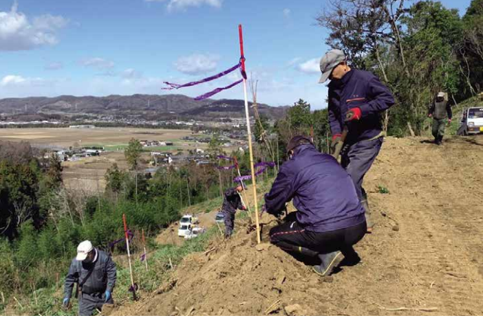
里山を整備して行われた植樹

桜川市では、第2次総合計画の中でまちの将来像として掲げる「ヤマザクラと市民の幸せが咲くまち 桜川」の実現のために「桜の里づくり支援事業」を推進しています。