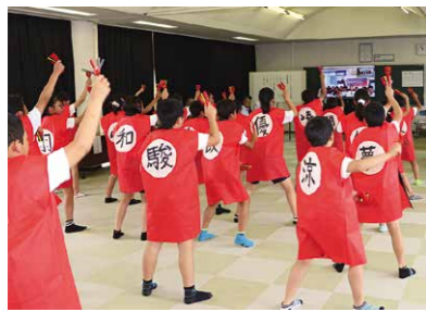
昨年6月に雨引小学校で市内3校目となるICT技術を用いた英会話交流事業が開始

さらに「教育支援センター」を活用した教育相談の充実を図り、不登校・ひきこもり問題の解消に努めてまいります。 また、東京オリンピック・パラリンピックの事前キャンプ地として、市民とともにモングル射撃選手団をおもてなしし、スポーツの魅力を発信してまいります。 ●文化財の保存活用 国指定天然記念物の「桜川のサクラ」の土壌調査などを行い、ヤマザクラの保全管理に努めてまいります。また「真壁の町並み」や「真壁城跡」