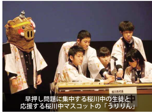
早押し問題に集中する桜川中の生徒と中 応援する桜川中マスコットの「うりりん」

この大会は、県の伝統や文化などを楽しみながら学び、郷土への愛着や誇りを高めることを目的に開催。県内各地の郷土に関する難問に、同中学校の生徒5人が知力を合わせ、チーム一丸となって挑みました。