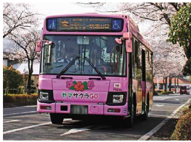
市の公共交通を担う広域連携バス「ヤマザクラGO」

新たに、公共交通の空白地域で市内巡回ワゴン運行の実証実験を行い、公共交通の充実を図ってまいります。広域連携バス「ヤマザクラGO」とあわせ、今後も市民が利用しやすい環境を整え、桜川市にふさわしい公共交通システムの構築を検討してまいります。