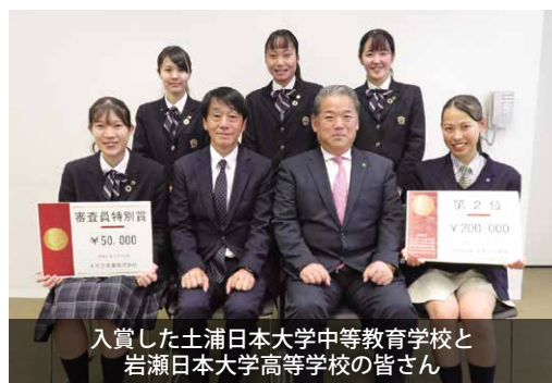
入賞した土浦日本大学中等教育学校と岩瀬日本大学高等学校の皆さん

同大会では、地域の課題を解決するための企画を立案したうえで、実践した成果を発表し、2月15日には真壁伝承館で市民に向けた発表会も行われました。