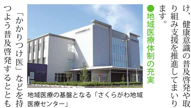
地域医療の基盤となる「さくらがわ地域医療センター」

●子育て支援の充実と少子化対策の推進 安心して子どもを産み、子育てができる環境をつくるため、多様なライフスタイルに対応し、保護者のニーズに沿った子育てと、就労の両立を支援するため「放課後児童対策事業」「ファミリーサポートセンター事業」「子ども・子育て支援交付金事業」を行ってまいります。 また、経済面の支援策として、本年度から「出産祝い金」の支給や第3子以上に対する「給食費の無料化」を行うとともに、引き続き「教育・保育施設等利用者負担額軽減化事業補助」「子どものための教育・保育給付事業」「新入学児童へのランドセルの支