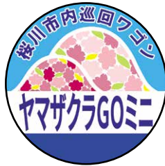
◇巡回ワゴンの停留所