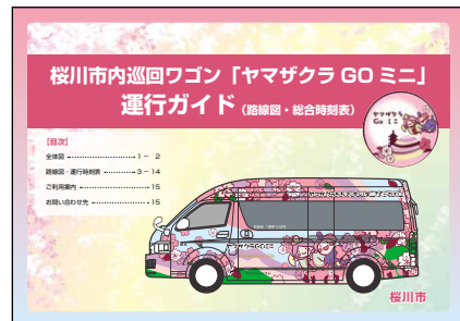
◇巡回ワゴン運行ガイド

詳細な運行内容については、運行ガイドを3月に全戸配布いたしますのでご覧ください。