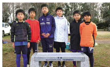
ベンチを寄贈したきたぐりユナイテッドFC 令和元年度卒団生の皆さん