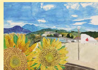
※入選 蛇澤 夏菜 (坂戸小6年)