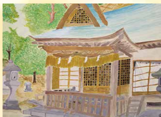
※入選 鈴木 慈恩 (大国小6年)