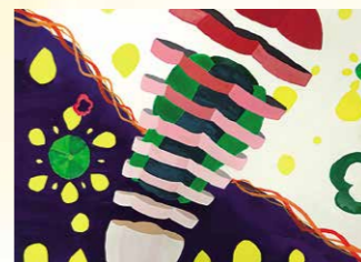
※入選 中里 凛 (大和中1年)