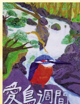
※特選 今井 爽太(南飯田小6年) 愛鳥週間用ポスターコンクール