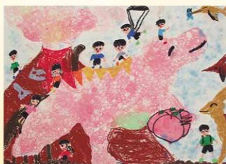
※入選 藤田 千陽 (谷貝小2年)