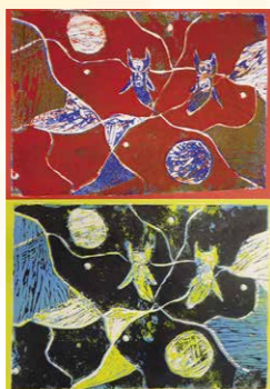
※入選 稲葉 悠人(桃山学園5年)