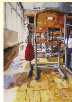
※入選 酒井 羽音(岩瀬西中2年)