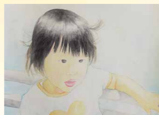
※入選 増瀬 萌未 (岩瀬東中3年)