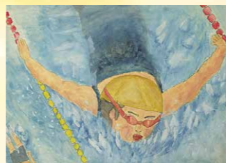
※入選 海老澤 仁奈 (岩瀬小4年)