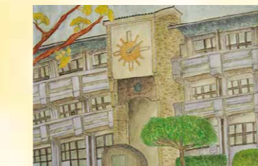
※入選 麻尾 美羽 (羽黒小6年)