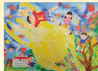
※入選 小口 航輝 (雨引小3年)