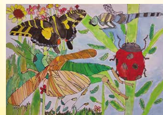
※入選 田口 颯葉 (樺穂小3年)

【人口】 39,598人 (- 13) 【男】 19,647人 (+ 32) 【女】 19,951人 (- 45) 【世帯】 13,799世帯 (+ 39) ( )は対前月増減 常住人口 令和2年2月1日現在