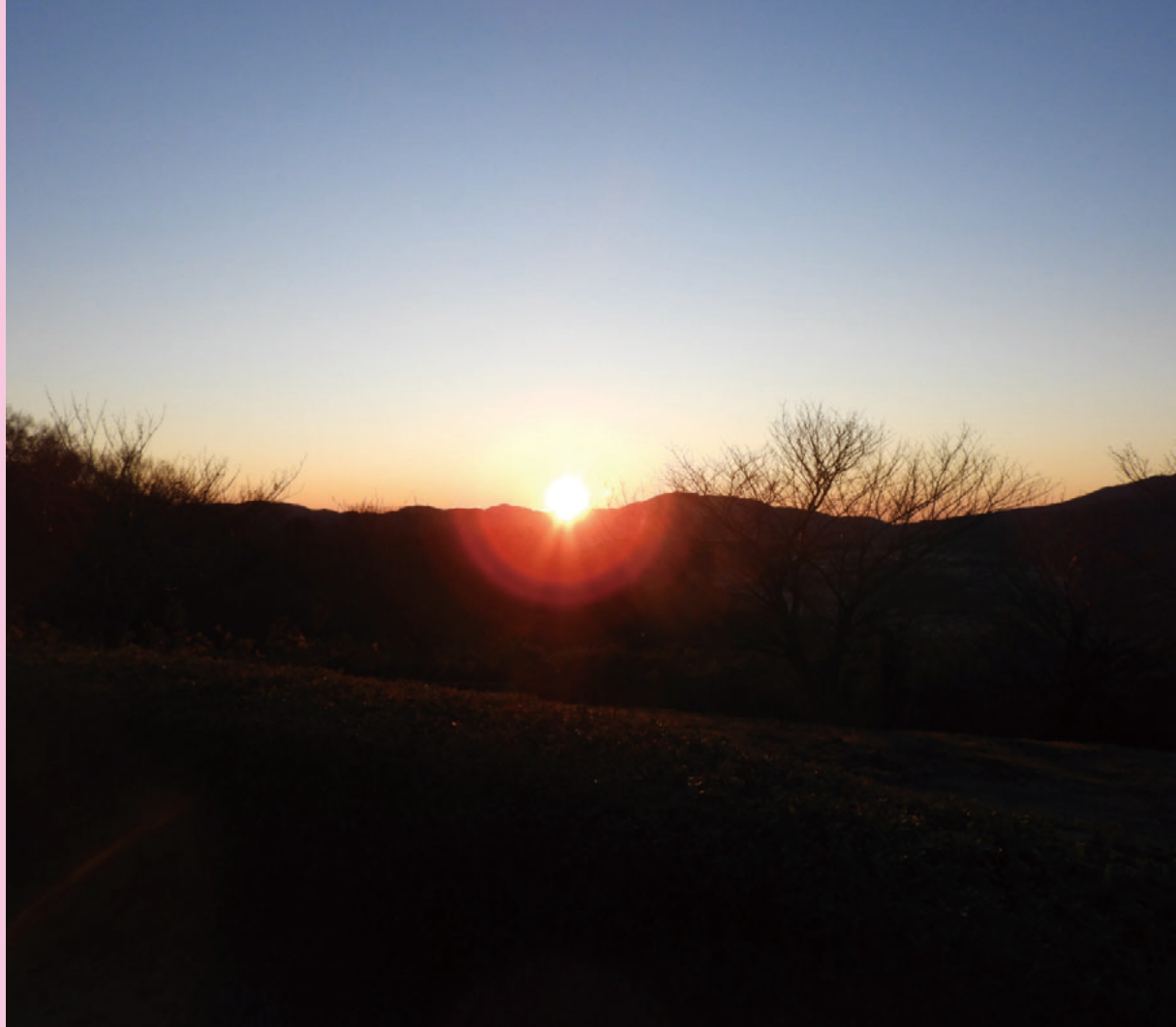
富谷山からの日の出