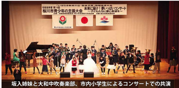
坂入姉妹と大和中吹奏楽部、市内小学生によるコンサートでの共演

12月8日、青少年育成桜川市民会議主催の「第14回桜川市青少年の主張大会」が、大和ふれあいセンター「シトラス」で開催されました。