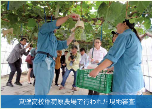
真壁高校稲荷原農場で行われた現地審査

グローバルGAPは、農業生産工程管理、または適正農業規範とも呼ばれ、食品安全・労働安全・環境保全の項目をクリアすることで認められ、「正しく・安全に農場運営と農業生産ができています」と第三者機関が証明する国際的な認証制度です。同校では、この認証取得に