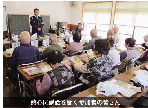
熱心に講話を聞く参加者の皆さん

講話後には、参加者に反射タスキや反射シールなども配布され、交通安全の意識高揚を図りました。