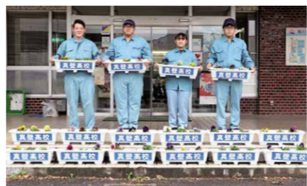
市役所大和庁舎にパンジーを届けた真壁高校生の皆さん

真壁高校から、農業科草花コース2・3年生が育てたパンジーの花が寄贈され、市役所大和庁舎に飾られました。