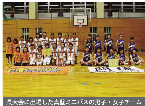
県大会に出場した真壁ミニバスの男子・女子チーム

県大会の予選となる県西部地区大会で、少人数で接戦を制してベスト4の男子チームと春・秋連覇の女子チームは、ともに県大会出場を果たして、迫力ある試合を見せて健闘しました。