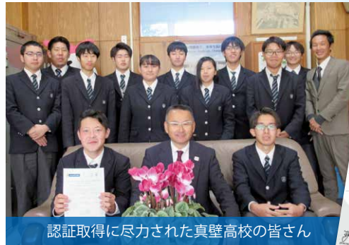
認証取得に尽力された真壁高校の皆さん

向けて、平成29年の先進校視察をはじめ、校内外研修や審査視察、模擬審査など2年以上にわたる活動を経て、10月8日に認証取得公開審査が行われ、見事認証取得の結果を得ることができました。