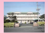
真壁消防署交差点からつくば方面1つめの信号を左折