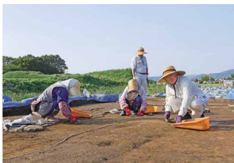
細部まで丁寧にられる発掘調査