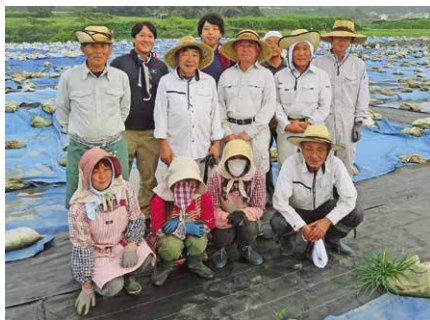
発掘調査を行う調査員の皆さん

現在の発掘調査は、三の丸と外曲輪の間にあたる中城で実施しています。中城には庭園があり、大きな池の周囲には茶室や能舞台のような建物が建てられ、迎賓館の役割を