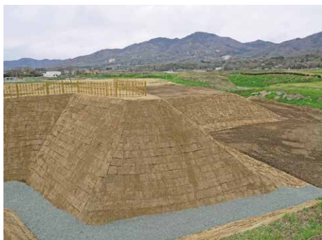
復元された真壁城跡南側の土塁・堀・木橋

毎年、少しずつ整備が進み、戦国時代の景観へと変わっていきます。何度も訪れて真壁城の変化を楽しんでみてはいかがでしょうか。