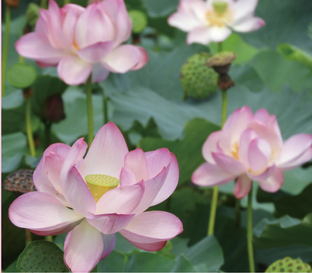
西小埜地区の寺前池