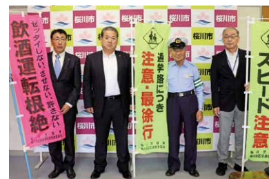
大塚市長にのぼり旗を寄贈する3団体の皆さん

桜川地区交通安全協会・桜川地区安全運転管理者協議会・桜川市交通対策協議会から、交通安全の啓発に役立てて欲しいと、のぼり旗の寄贈がありました。