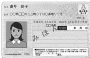
○ マイナンバーカード