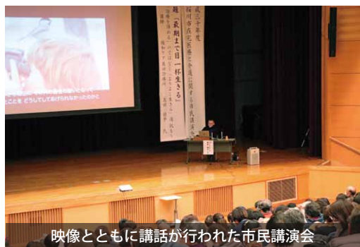
映像とともに講話が行われた市民講演会

患者やその家族の声と映像を交えて行われ、来場した229名の市民にとって、人生の最期をどのように迎えるかを深く考えるいいきっかけとなりました。