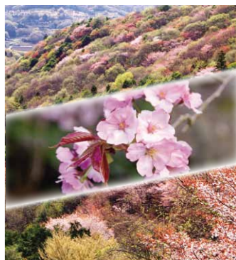
写真は、市内北部に自生するヤマザクラを過去に撮影したものです。市の森林面積に対し天然林面積に占めるヤマザクラの本数を調査し、市内には、55万本以上のヤマザクラがあるとされ、今後も、ヤマザクラを活かしたまちづくりを進めていきます。