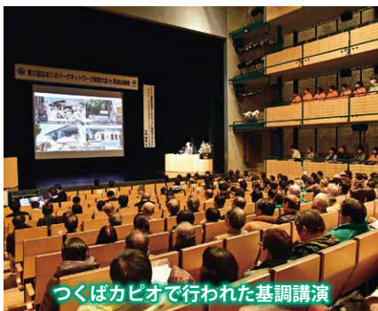
つくばカピオで行われた基調講演

今大会は関東地域のジオパーク関係者や一般の方が参加する大会で、1日目は筑波山や霞ヶ浦へのジオツアーが行われました。ジオガイドから筑波山地域の成り立ちなどの説明を聞き、楽しみながら当地域のジオを学びました。また、ユニバーサルデザインを学ぶジオツアーも企画され、すべての人が楽しめるジオツアーの提案も行われました。