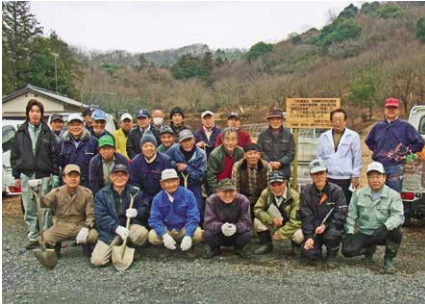
青木地区の植樹作業に参加した皆さん

同事業は、市が山桜の育成環境整備・保全を行う行政区に対し、活動助成金や山桜の苗木などを支援し、山桜が咲く美しい里山の景観をつくっていくもので、現在、青木地区、羽鳥地区、平沢地区、山尾地区で実施しています。