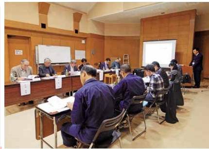
委員会で議論を重ねて保全活用計画を策定

平成29年10月20日の委員会発足から6回の協議を経て、2月の同委員会で計画を策定。今後は、同計画書をもとに①名勝・天然記念物のサクラ②里山③人材育成と普及啓発④情報発信の各分野において、実質的な活動を行っていきます。 また、計画の策定を記念して、市民の方々向けに第1回さくらがわ山桜シンポジウムを開催しますので、ぜひご参加ください。