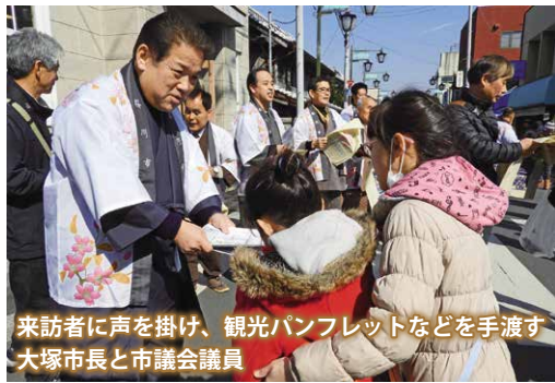
来訪者に声を掛け、観光パンフレットなどを手渡す大塚市長と市議会議員

1人でも多くの方に桜川市を知ってもらおうと、作務衣や着物、市の法被姿の大塚市長や市議会議員が、来訪者に観光パンフレットなどを手渡し、市のPRをしました。