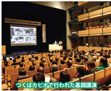
つくばカピオで行われた基調講演

今大会は関東地域のジオパーク関係者や一般の方が参加する大会で、1日目は筑波山や霞ヶ浦へのジオツアーが行われました。ジオガイドから筑波山地域の成り立ちなどの説明を聞き、楽しみながら当地域のジオを学びました。また、ユニバーサルデザインを学ぶジオツアーも企画され、すべての人が楽しめるジオツアーの提案も行われました。