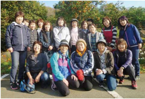
健康推進員の皆さん

健康推進員は、自身の健康づくりを実践しながら、家族や地域の健康づくりを支援する各行政区、122名のリーダーです。