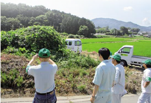
農地パトロールを行う様子