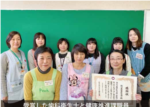
受賞した歯科衛生士と健康推進課職員

第27回茨城県民歯科保健大会が水戸市で開催され、健康推進課が歯科医師会長賞を受賞しました。今回の受賞は、歯科医師会や市内の歯科衛生士と連携して実施している口腔機能検査や、お口さわやか教室などの歯科保健対策の長年の取り組みが高く評価されました。今後市民の皆さまの歯と口腔の健康づくりに努めていきます。