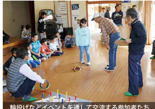
輪投げなどイベントを通して交流する参加者たち

東友部地区で、地域の3世代が交流する「とんべ・よかつぺ祭り」が開催されました。この祭りは、希薄になりつつある地域交流を取り戻すことを目的に始まり、今年で4回目の開催。「みんなが楽しめる」を目標に、地区の役員や子ども会などが地域一丸となって祭りを企画しました。新人生紹介コーナーやフラダンス鑑賞、屋台などが催され、地域の交流を深めました。