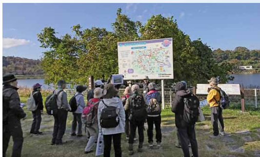
つくし湖でジオガイドの案内を受ける参加者

11 月25日にツアーが開催された酒寄・椎尾地区は、筑波山の西麓に位置し、筑波山男体山までの登山道があり、古くから筑波山とは関りの深い地区です。