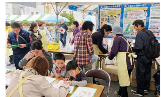
SAKURA フェスティバルで健診受診をPR

動を行ったり、生活習慣病予防の取り組みを行っています。 また、市が実施する乳幼児健康診査に協力し、お子さんの身体計測の記録や測定の見直しなどを行ったり、イベントでは大腸がん検診のパネル展示を行い、健診の受診を呼びかけました。 今後も、健康づくりに関する正しい情報と知識を身につけて地域に発信することで、市民の健康づくりに貢献していきます。