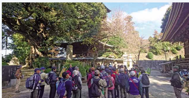
参加者が訪れた椎尾山薬王院

ツ アーでは、霞ヶ浦用水事業により筑波山をトンネルでくり抜いて出来た人造湖のつくし湖を造る際に掘り出された筑波山内部の岩石の種類を学び、椎尾山薬王院では、山の中腹で出来る温かい空気の層「斜面温暖帯」とお寺の開山との関係について、副住職からお話を聞きま