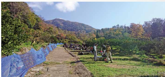
筑波山の男体山を望むみかん園

ツ アーでは、霞ヶ浦用水事業により筑波山をトンネルでくり抜いて出来た人造湖のつくし湖を造る際に掘り出された筑波山内部の岩石の種類を学び、椎尾山薬王院では、山の中腹で出来る温かい空気の層「斜面温暖帯」とお寺の開山との関係について、副住職からお話を聞きま