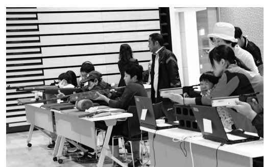
射撃体験教室の様子