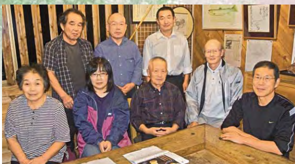
竜ヶ井城山の会の皆さん

を通して、地域活性化に協力したい」と今後の活動について話してくれました。その他にも、竜ヶ井城の勉強会なども開催していく予定です。