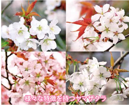
様々な特徴を持つヤマザクラ

世界には100種類ほどの野生種のサククラがあると言われ、日本には11種類の野生の