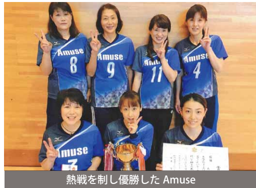
熱戦を制し優勝した Amuse

大会には、市内のママさんバレーボール7チームが参加。各チームが優勝を目指して熱戦が繰り広げられ、Amuseが見事優勝しました。ママさんバレーボール連盟では、この大会のほかにも親善大会などを開催し、チーム間の交流を深めています。