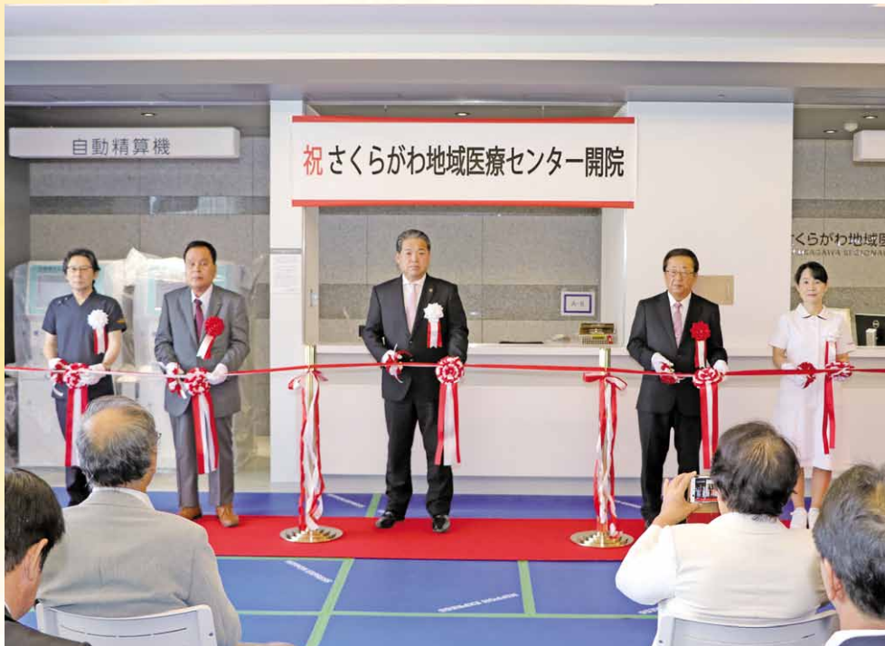
開院式で行われたテープカット