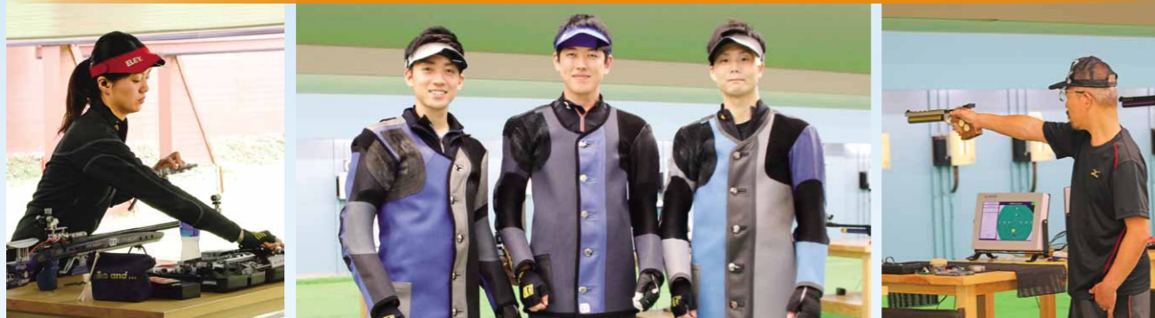
茨城県選手入賞者一覧