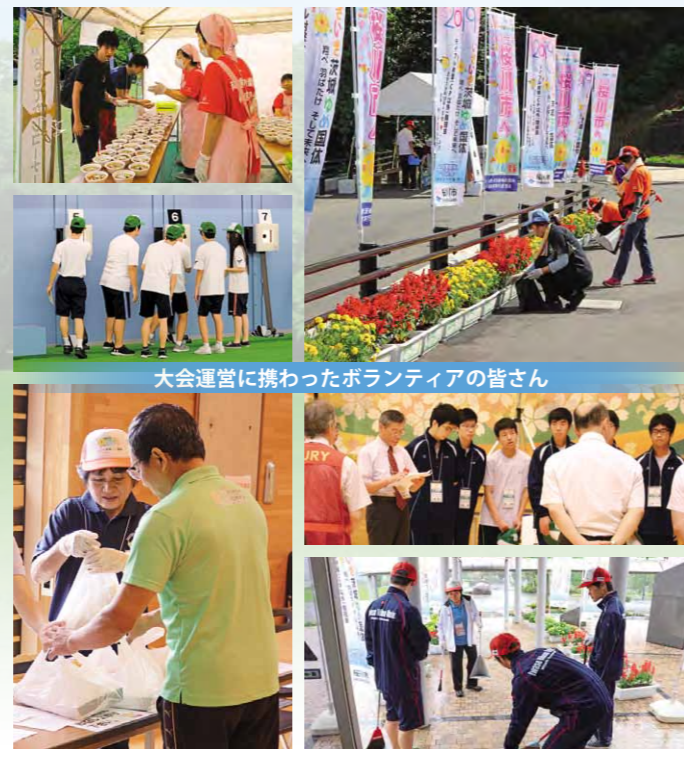
大会運営に携わったボランティアの皆さん