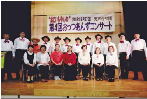
おつつあんずとコンサートに出演された皆さん

コンサートにはおつつあんずの12名が出演し、伴奏に合わせ12曲を熱唱しました。特に「かあさんの歌」では、それぞれが母親の思い出を語り、観客者を魅了しました。