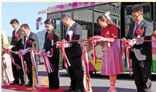
秋晴れのなか行われたテープカット