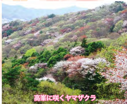
高峯に咲くヤマザクラ

里山に自生するヤマザクラにも、公園などで見るサククラとは違った魅力があります。生き生きとした野生のヤマザクラの咲く頃、その真っ赤な新芽と他の木々の萌え出る新緑とが織り成す景観は、人の手では決して作り出すことのできない絶景です。