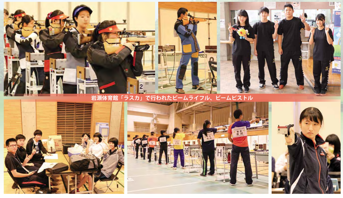
岩瀬体育館「ラスカ」で行われたチームライフル、チームピストル