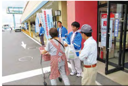
店頭で実施された下水道接続促進街頭キャンペーン

同キャンペーンは、全国下水道促進デーとして始まった「下水道の日」の活動の一環として行われ、当日は、買い物客の皆さんにリーフレットや啓発品を配布。河川や湖の水質向上のため、早期接続の協力を呼びかけました。