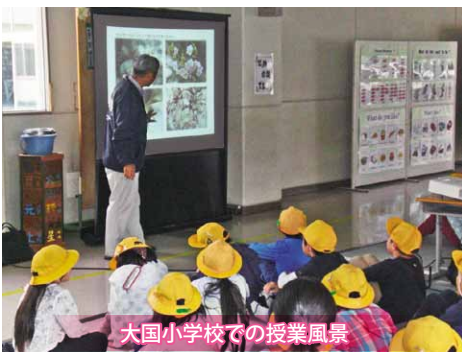
大国小学校での授業風景

この様な体験をした児童たちが、年月を重ねても変わらずに「桜川のヤマザクラ」に対する思いを持ち続けてもらうためにも、市民の皆さまも一丸となって、ヤマザクラを大切に守り育てていきましょう。