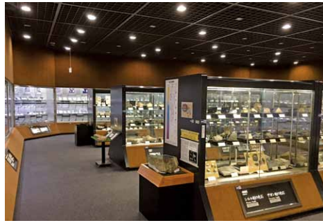
館内では様々な鉱物や岩石を展示

世界中の鉱物や岩石が展示されており、企画展や夏休みの体験イベントなども開催されます。一度訪れてみては、いかがでしょうか。