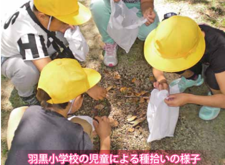
羽黒小学校の児童による種拾いの様子

今年、羽黒小学校、谷貝小学校、大国小学校の3・4年生が参加し、櫻川磯部稲村神社（磯部地区）、五所駒瀧神社（真壁町山尾地区）、暁静山薬王寺（青木地区）で種拾いが行われました。