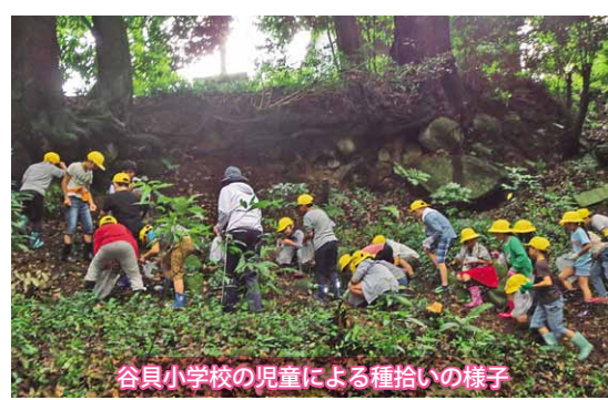
谷貝小学校の児童による種拾いの様子

本市のヤマザクラの歴史、市内の名所、桜の種類など、写真を交えた授業に、児童たちは目を丸くさせて驚いたり、元氣よく挙手をして質問をしたりしていました。桜