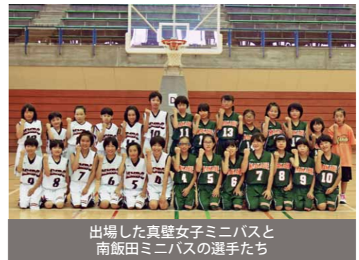
出場した真壁女子ミニバスと南飯田ミニバスの選手たち

真壁女子ミニバス・南飯田ミニバスが、県大会に出場 水戸市で開催された第37回関東ブロックスポーツ少年団競技別交流大会（ミニバス）茨城県予選大会に、地区予選を勝ち抜いた真壁女子ミニバスケットボール少年団と南飯田ミニバスケットボール少年団が出場し、両チームはベスト16という成績を収めました。 選手たちは「練習を頑張つて、次の大会では絶対に勝ちます」と話していました。