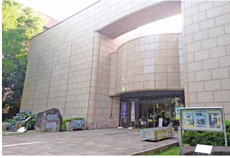
地質研究活動の成果が見学できる地質標本館

この施設では、国の機関である産業技術総合研究所地質調査総合センターの研究活動で得られた成果を見学できます。また、最新の地球科学情報とともに、地震や火山などの地球活動がテーマごとに展示されています。