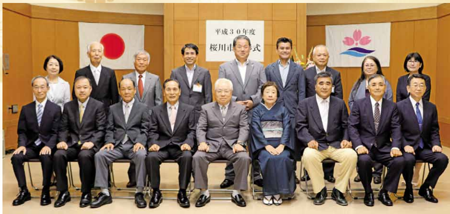
市役所大和庁舎で開催された桜川市表彰式に出席した皆さん