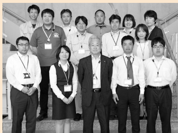
生涯学習課の職員

これからも地域の皆さまと協力して、生涯学習推進や青少年育成、文化財の保護などに努めていきます。 ■問合先/生涯学習課(☎0296-20-6300)