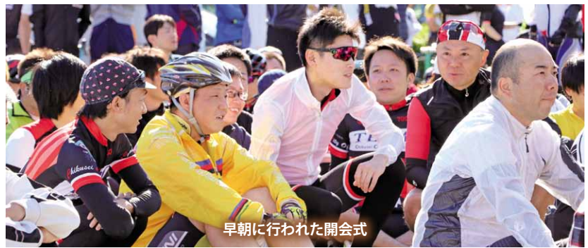
早朝に行われた開会式