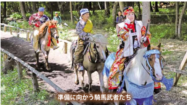
準備に向かう騎馬武者たち