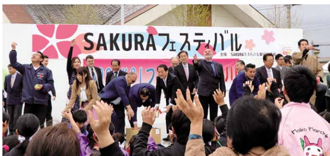
昨年に引き続き、開会式後に行われたラッキーカラーボールに参加