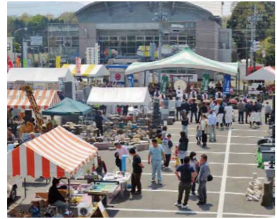
昨年行われた大和の石まつり