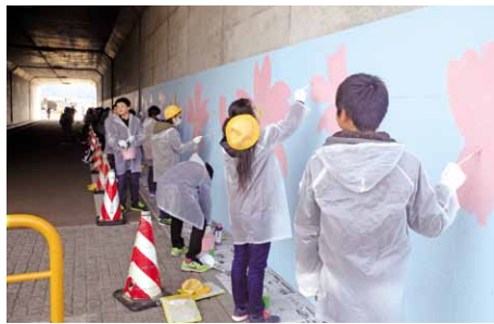
トンネルの壁画に桜を描く平成29年度岩瀬小学校卒業生

制作には3時間をかけ、絵が完成すると、トンネル内から「やったあ」「きれいだね」という歓声が上がりました。