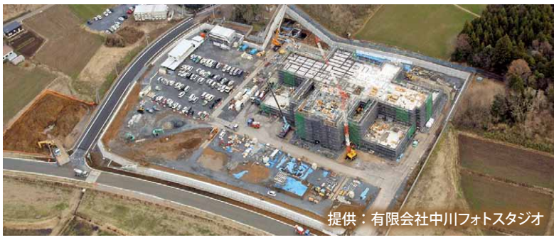
さくらがわ地域医療センター全景

3月末時点において、3階や屋上のコンクリートを打設し、上棟しました。外壁のタイル貼りや窓枠の設置、内装工事などが始まっています。