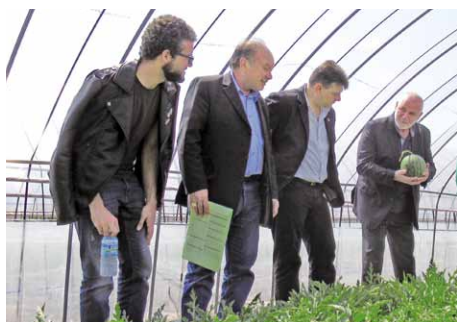
スイカ圃場を視察する シリストラ市桜川訪問団の皆さん