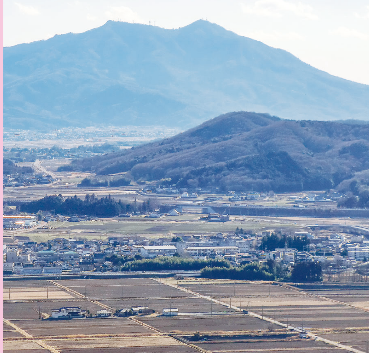
富谷山から筑波山を望む