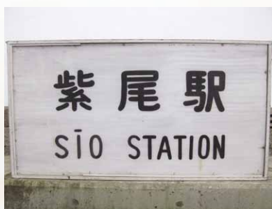
旧紫尾駅の駅名表示板

筑波鉄道はその名の通り、筑波山の麓を南から西、北へぐるりと回るように走り、筑波山観光客の輸送を主軸に、沿線の住民の足として利用さ