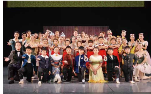
バレエ団の皆さんと共演した児童たち

バレエが始まると、ダンサーたちの華麗な動きや煌びやかな衣装、大がかりな舞台装置や照明など劇場の雰囲気味わうことができました。 劇中には5年生児童が出演し、児童や保護者・地域の方々も一緒になって、楽しいひとときを過ごしました。