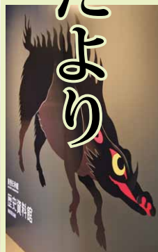
No.71 教育委員会生涯学習課 文化財グループ (☎ 0296-20-6300)