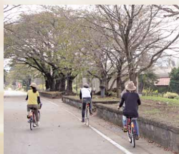
路線跡を再活用して整備された自転車道(りんりんロード)

れていました。現在の桜川市内には南から、酒寄、紫尾、常陸桃山、真壁、樺穂、東飯田、雨引、岩瀬の各駅がありました。