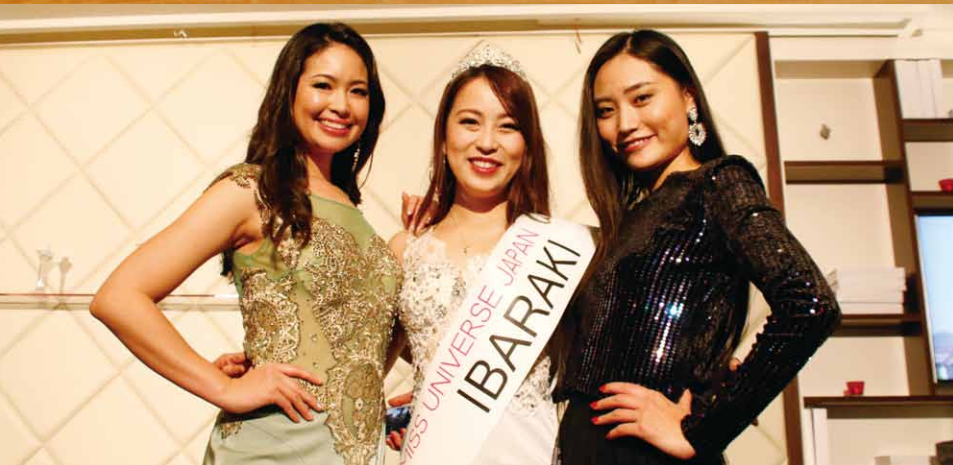
2018 ミス・ユニバース・ジャパン茨城大会決勝