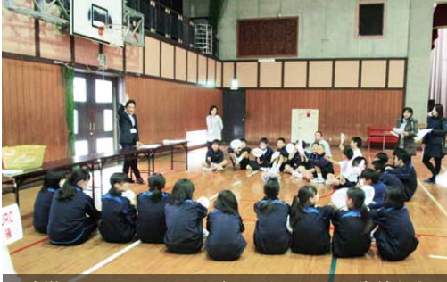
防災シミュレーションゲームをしている生徒たち

当日は、AED体験やHUG（避難所運営ゲーム）、JRC（防災シミュレーションゲーム）、応急担架作成体験、消火器体験などを行いました。