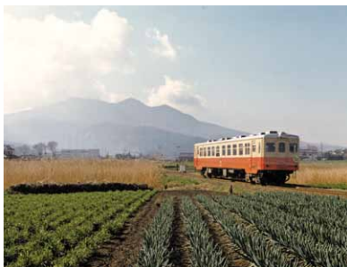
真壁町白井地内にて

皆さんは「筑波鉄道」をご存知でしょうか。かつて土浦～岩瀬間40.1kmを結んでいたこの鉄道は、今からちょうど百年前の大正7年(1918年)に開業しました。