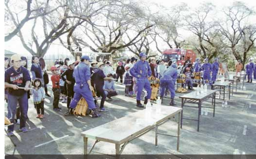
ゲーム形式で行われた消防体験

交流会は、協力・助け合いの大切さを再認識してもらい、消防団などの地域貢献の心を育むことを目的に開催。桜川消防署と大和地区の消防団員の皆さんが案内役を務めました。 消防体験は、消防団が使う機材を使って、ゲーム形式で3種類の競技が行われました。