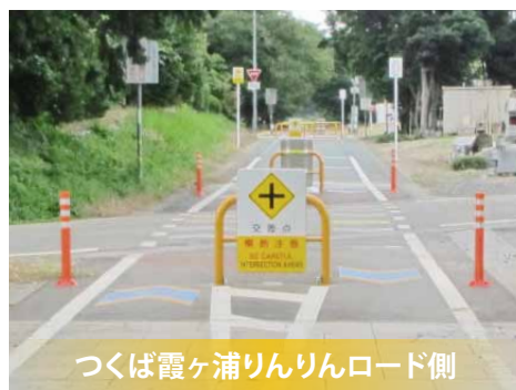
つくば霞ヶ浦りんりんロード側