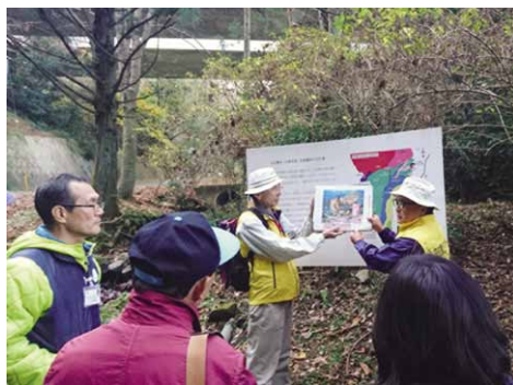
地域の魅力を伝えるジオガイド