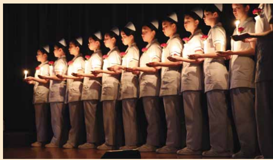
ナースキャップを戴き、新たな誓いを立てる生徒たち

6月2日、県立岩瀬高等学校で、「第46回戴帽式」が行われました。多くの来賓・保護者の皆さんや、在校生が見守る中、衛生看護科3年生40人がナースキャップを戴き、新たな誓いを立てました。