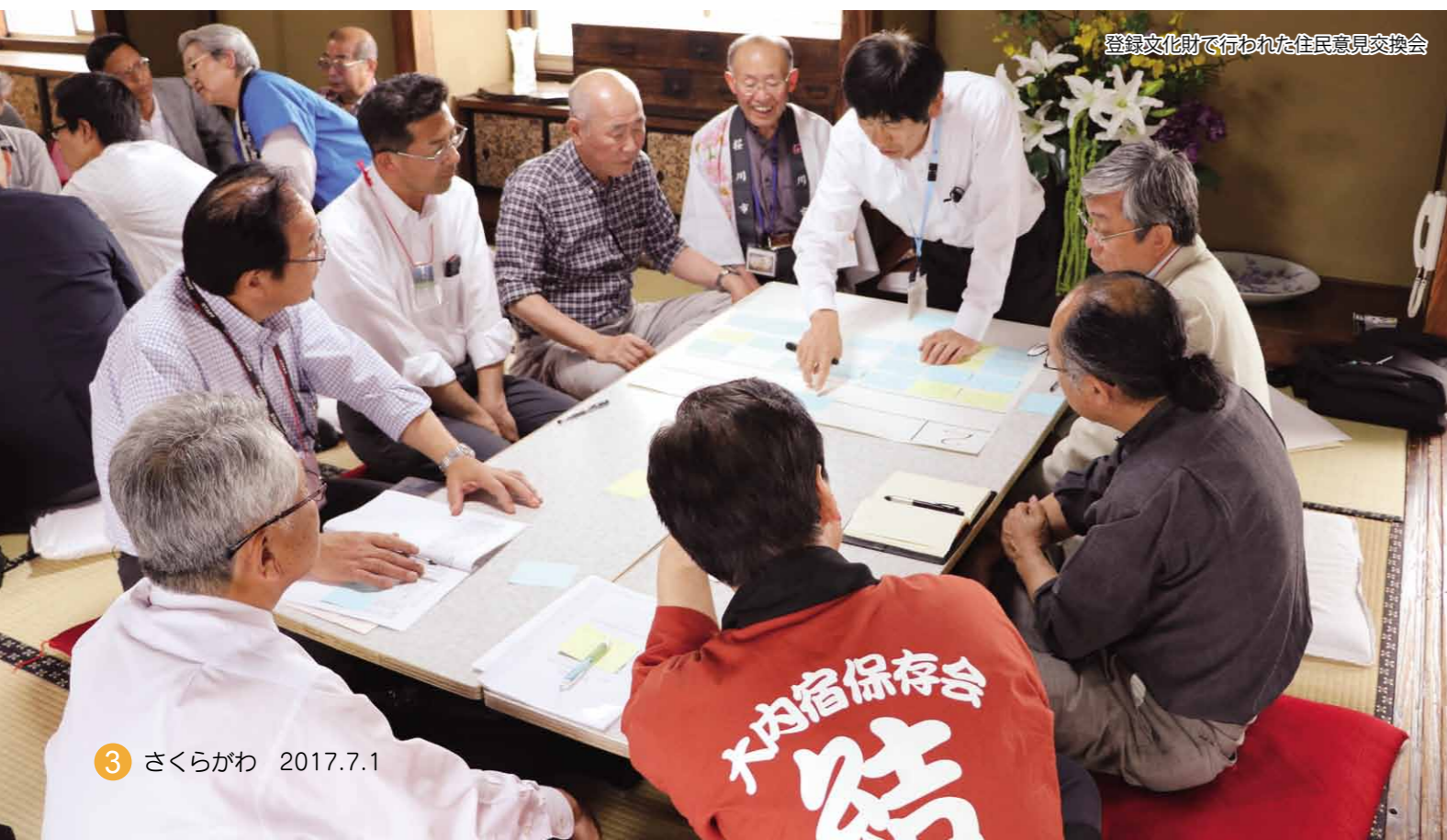
登録文化財で行われた住民意見交換会

今大会は、真壁の町並みの保存や活用に携わる住民の方々が中心となって企画や運営を行いました。町並み見学での休憩所おもてなしも、大会ボランティアとして市民の方々の協力で実施しました。市民の皆さまの力で、充実した大会となりました。