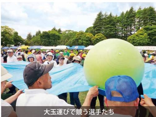
大玉運びで競う選手たち

ひたちなか市の笠松運動公園競技場で、『第19回ゆうあいスポーツ大会』が開催されました。 同大会には、県内から障がいをもつ方が集い、本市からは競技会に2名、レクリエーション競技に16名の選手が出場。4つのチームに分かれたレクリエーション競技では、大玉運びや組対抗リレーなどの競技で優勝を目指し、奮闘しました。