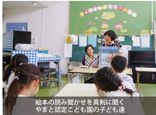
絵本の読み聞かせを真剣に聞くやまと認定こども園の子ども達

若い女性の乳がん・子宮がん検診受診率の向上のため、こども園などでがん検診の啓発を実施しました。 当日は、健康推進員による絵本の読み聞かせと、子どもから母親に宛てたメッセージカードを制作。 子ども達は、大好きなお母さんに元気でいて欲しいという願いを込めて、似顔絵やメッセージを一生懸命書いていました。