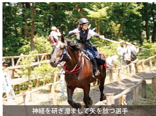
神経を研ぎ澄まして矢を放つ選手

毎年5月の第3日曜日に開催している大和流鏝馬合戦が、今年も大和ホースパークで行われました。 本合戦は、日本古来の伝統武芸である流鏝馬をスポーツとして競技化したものです。訪れた観客は、選手が放った矢が的に命中する度に歓声を上げていました。 当日は流鏝馬のほかに、フォトコンテストやポニー引き体験などが行われました。