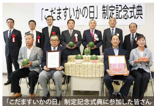
「いただきますの日」制定記念式典に参加した皆さん