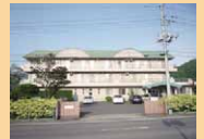
真壁消防署の交差点からつくば方面1つめの信号を左折