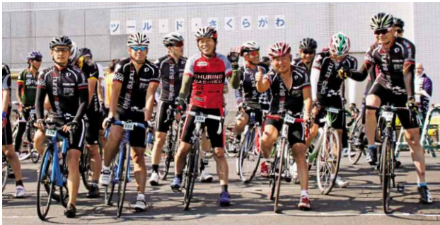
笑顔でスタートを待つ参加者たち

新緑に色づく季節、毎年この時期に行われるロングライドサイクルイベント『ツール・ド・さくらがわ』は、桜川市とその周辺地域の景観や町並みの魅力を感じながら長距離のサイクリングを楽しむことができる人気イベントで、今年は5月21日に開催され、約600人のサイクリストが参加し、市内が賑わいました。