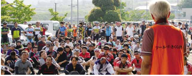
600人が参加して行われた開会式