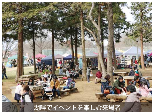
湖畔でイベントを楽しむ来場者

今年も上野沼やすらぎの里キャンプ場で、森コミいち(森コミいち実行委員会主催)が開催されました。 イベントでは、県内外の作家によるクラフト作品の展示販売や、各種ワークショップなどが行われました。また、湖畔ではジャズライブをはじめ、アーティストたちによる演奏が披露され、来場者は流れてくる音楽に耳を傾けながら、イベントを楽しみました。