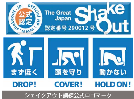
シェイクアウト訓練公式ロゴマーク

姿勢を低く、頭を守って、動かない シェイクアウト訓練実施 筑西広域消防管内で、シェイクアウト訓練が実施されました。 シェイクアウト訓練とは、「姿勢を低く、頭を守って、動かない」という身を守るための基本的動作を、家庭・学校・職場など場所を問わずに行う訓練です。 当日は市内17の学校、21の事業所など約6,000人が、10時の防災無線を合図に一斉に訓練を行いました。