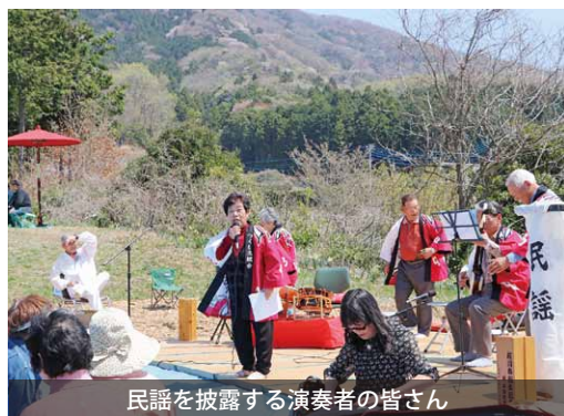
民謡を披露する演奏者の皆さん

ヤマザクラの名所で知られる平沢地区の林道入口付近の保ちゃん広場で、高峯の山々を背景に山桜祭りが開催されました。 当日は市内団体による民謡や琴、お囃子などが披露され、茶会や写真展示もあり多くの来場者が賑わいました。来場者は甘酒やゆず茶を片手に演奏を聴きながら、鮮やかな淡紅色に染まった高峯のヤマザクラを觀賞しました。