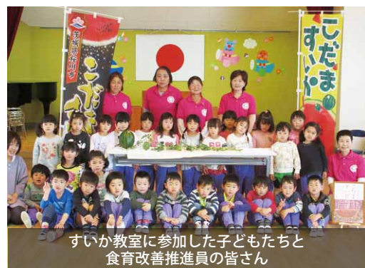
すいか教室に参加した子どもたちと食育改善推進員の皆さん