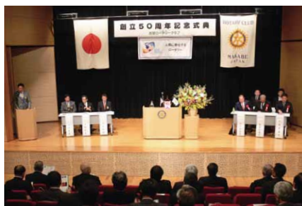
4月8日に行われた真壁ロータリークラブ創立50周年式典

購入費として2万円の寄付、さらに、市社会福祉協議会に高齢者福祉に役立てて欲しいと1万円の寄付がありました。