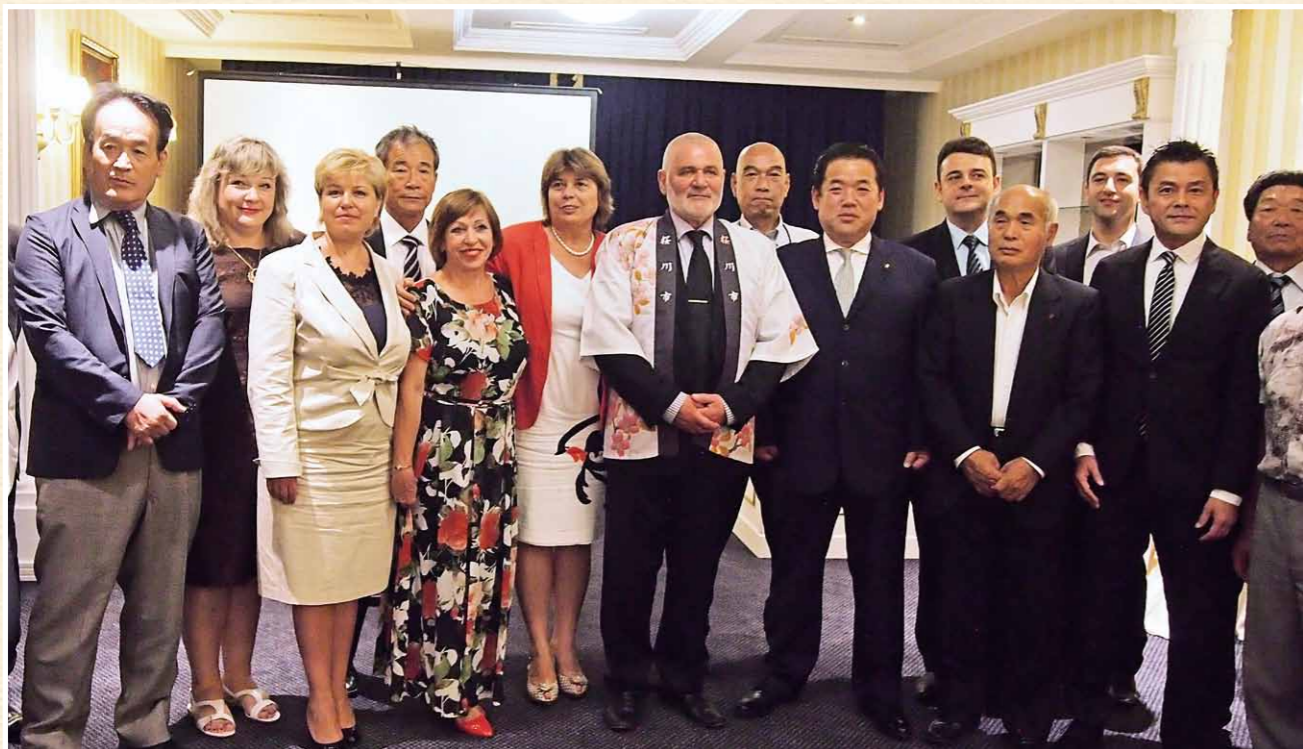
シリストラ市の皆さんと交流を深める桜川市シリストラ訪問団