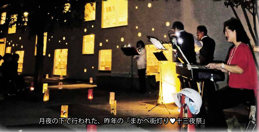
月夜の下で行われた、今年の「まかべ街灯り♥十三夜祭」

主催者は、「町内に設置されている行灯を利用して灯りのイベントを開催し、より多くのお客様に足を運んでいただけるようにしたい」と思いました。『いい町ですね!』と言