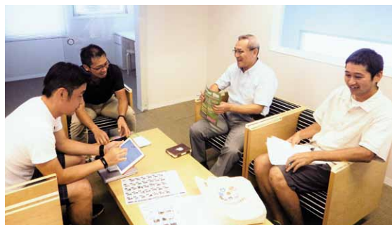
楽しいイベントを目指して、意見交換する実行委員の皆さん

このイベントは、昨年、市が主催した「桜川市UIターンワークショップ」で知り合った、桜川市出身の東京在住者と、市内在住者によって企