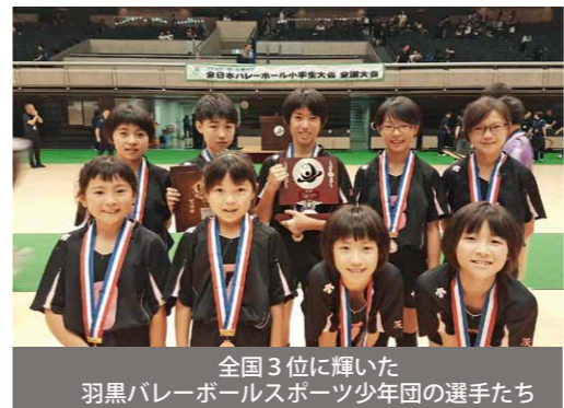
全国3位に輝いた羽黒バレーボールスポーツ少年団の選手たち

全日本バレーボール小学生大会第3位 羽黒バレーボールスポーツ少年団 ファミリーマートカップ第36回全日本バレーボール小学生大会が、東京都渋谷区の東京体育館などで開催されました。 同大会は、各都道府県大会を勝ち抜いた48チームが参加。羽黒バレーボールスポーツ少年団は、茨城県代表として熱い戦いを繰り広げ、2日間にわたる予選を勝ち抜き、決勝トーナメントに進出。見事3位を勝ち取りました。