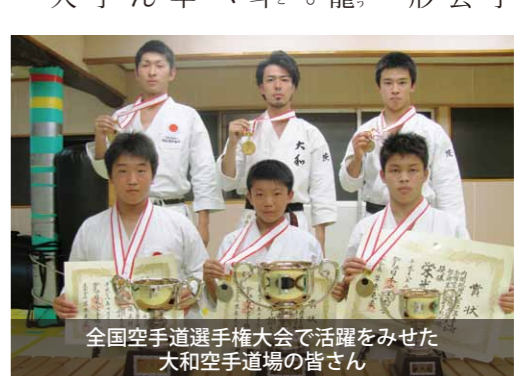
全国空手道選手権大会で活躍をみせた大和空手道場の皆さん

全日本バレーボール小学生大会第3位 羽黒バレーボールスポーツ少年団 ファミリーマートカップ第36回全日本バレーボール小学生大会が、東京都渋谷区の東京体育館などで開催されました。 同大会は、各都道府県大会を勝ち抜いた48チームが参加。羽黒バレーボールスポーツ少年団は、茨城県代表として熱い戦いを繰り広げ、2日間にわたる予選を勝ち抜き、決勝トーナメントに進出。見事3位を勝ち取りました。