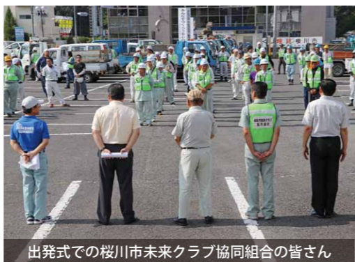
出発式での桜川市未来クラブ協同組合の皆さん

市内の建設業63社で構成される桜川市未来クラブ協同組合の皆さんが、ボランティアで市内主要道路の清掃活動を実施しました。 この活動は、道の日に合わせて、筑西土木事務所が毎年開催。今年は「道きれいそんな所は人きれい」をテーマに行われました。 桜川市では、総勢1677人の皆さんが20班に分かれ、清掃活動に汗を流しました。