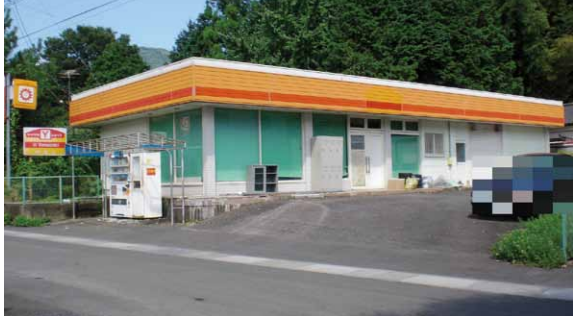
28 - 5

・公売の詳細については、収税課(大和庁舎)、総合窓口課(岩瀬・真壁庁舎)に備えてあります「公売参加のご案内」または市のホームページをご覧ください。 ※公売とは、市税(国保税を含む)滞納により差押えた不動産を入札により売却し、代金を滞納税に充当するものです。