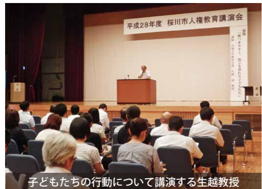
子どもたちの行動について講演する生越教授