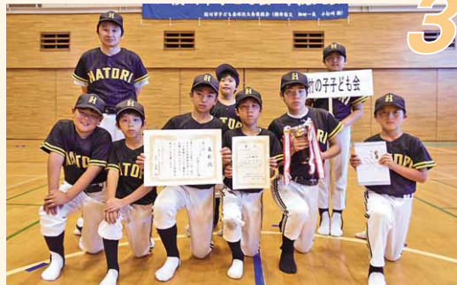
第3位「羽鳥竹の子子ども会」(真壁町羽鳥地区)