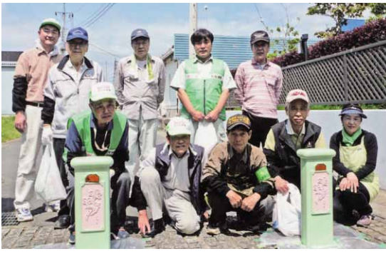
連絡通路ガードポール塗装後の美化推進隊の皆さん

桜川区では、地域の特色を踏まえて「桜川行政区の運営指針」を策定し、区の共通課題として、美化・防犯・交通安全・危険防止・コミュニケーション・防災活動などに取り組んでいくことを明確にしました。