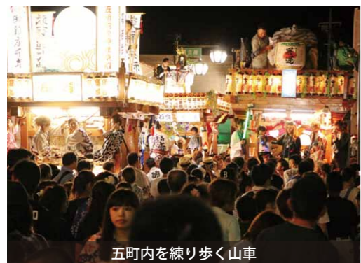
五町内を練り歩く山車

約400年の歴史を持つ真壁祇園祭が開催され、真壁の伝統的な町並みの中を、華やかに飾られた山車が、威勢の良い若衆たちに曳かれ、五町内を勇壮に練り歩きました。 山車は、真壁町内の高上町・仲町・新宿町・上宿町の4台。山車運行をまとめる若衆当番町は、輪番制になっています。見物人の1人は、「すごい迫力」と話していました。