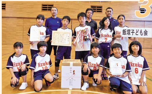
第3位「飯塚子ども会」(真壁町飯塚地区)