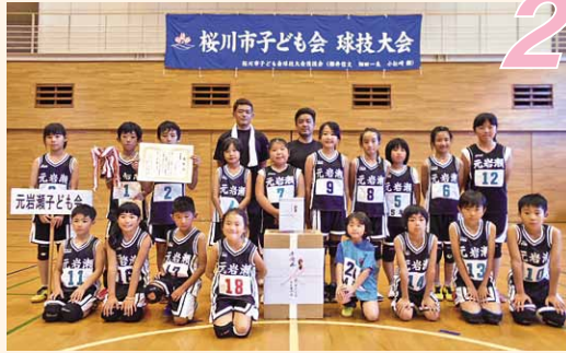
準優勝「元岩瀬子ども会」(岩瀬地区)