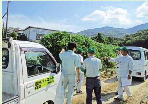
農地パトロールを行い、現況を確認している様子

今後は、農地パトロールの結果を踏まえて、所有者に対して「利用意向調査」を実施します。