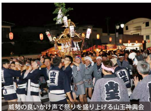
威勢の良いかけ声で祭りを盛り上げる山王神輿会

岩瀬駅前夏祭りが開催され、JR岩瀬駅前通りを中心に、神輿と山車が賑やかに通りを練り歩きました。 この祭りは、昭和30年ごろに岩瀬東区・西区、犬田地区を中心に始まり、年々、駅前環境の変化などに対応しながら開催されてきました。 今年は神輿10台と山車7台が参加。駅前に一堂に会し、威勢の良いかけ声と御囃子で祭りを盛り上げました。