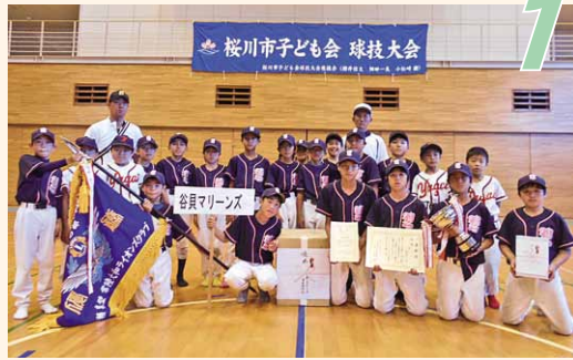
優勝「谷貝マリーンズ」(谷貝小学区)