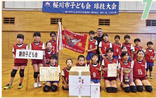
優勝「鉾田子ども会」(鉾田地区)