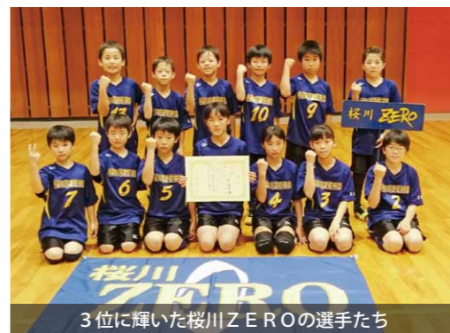
3位に輝いた桜川ZEROの選手たち

「笠松スポーツフェスティバル・ドッジボール大会」が、ひたちなか市の笠松運動公園体育館で開催されました。 同大会には、県内から屈指の強豪チームが参加。トーナメント形式で、白熱した試合が行われるなか、出場した桜川ZEROは、見事3位入賞に輝きました。 今後もチーム二丸となり、常に全力でプレーして試合に臨みます。