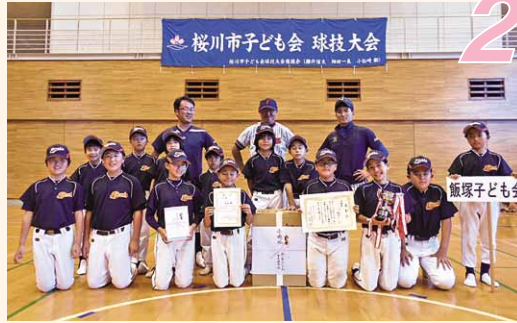
準優勝「飯塚子ども会」(真壁町飯塚地区)