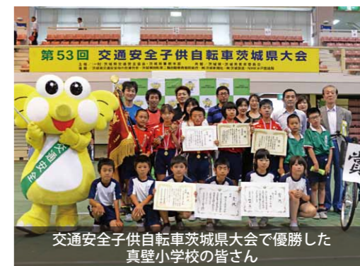
交通安全子供自転車茨城県大会で優勝した真壁小学校の皆さん

第53回交通安全子供自転車大会が茨城県大会が開催され、団体の部で真壁小学校が通算16度目の優勝を収め、2連覇を達成しました。 この大会は、県内各市町村の小学校から4人の児童が参加。学科と実技試験で点数を競いました。 茨城県代表として出場した全国大会は、惜しくも入賞を逃しましたが、練習の成果を発揮して健闘しました。