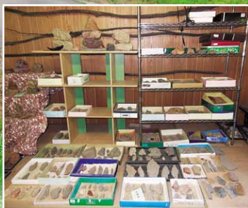
小さな考古資料室のようす