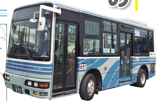
運行車両と同型の中型バス