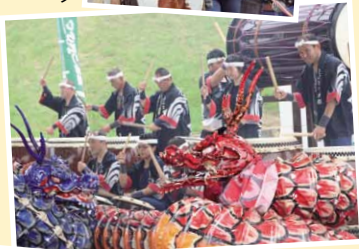
しらとり太鼓演奏