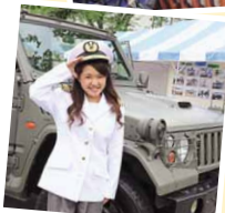
陸上自衛隊特別展示