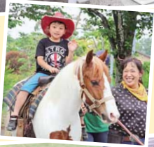
大和ホースパーク