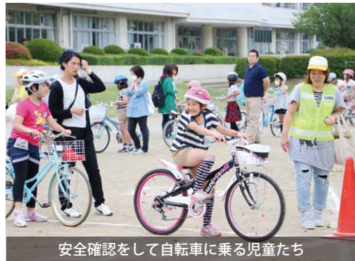
安全確認をして自転車に乗る児童たち

児童たちは、安全な自転車の乗り方の説明を受けた後、自分の自転車で実技を学びました。