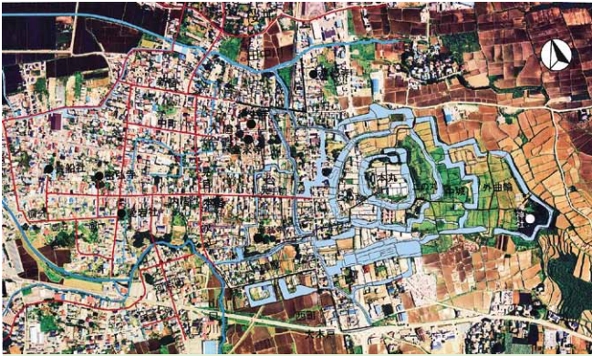
航空写真：国史跡・真壁城跡（右）と重要伝統的建造物群保存地区「真壁の町並み」（左）