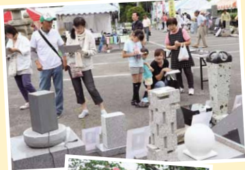
石あかりコンテスト