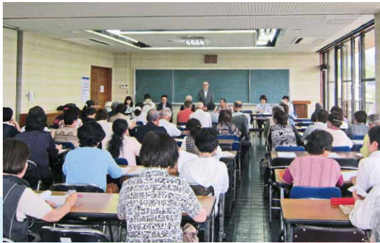
新体制について協議した平成28年度 桜川市文化協会総会

文化協会会則（案）として提出され、了承されました。今後は、部会組織という新体制のもとで、会員の連携・交流が深まり会員の自主性が促され、人材の育成と文化活動の更なる展開並びに桜川市の文化施策に貢献できることを目指していきます。