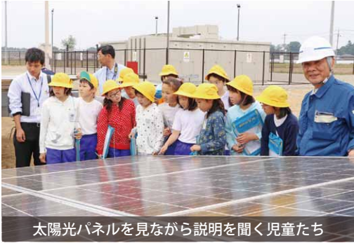
太陽光パネルを見ながら説明を聞く児童たち

児童たちは発電所見学後、谷貝小学校に移動し、太陽光発電の話の聞いたり、ソーラーカーキットを作成したりしました。