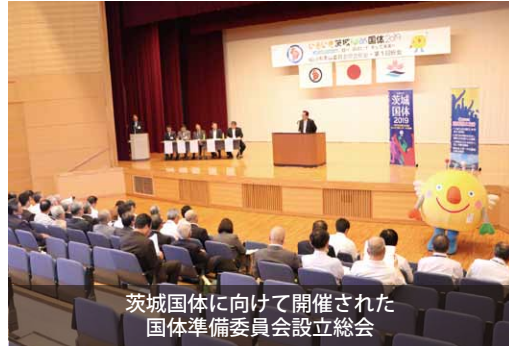
茨城国体に向けて開催された 国体準備委員会設立総会

国体開催まで常任委員会や各専門委員会を開き、開催に向けた骨格づくりを進めていきます。