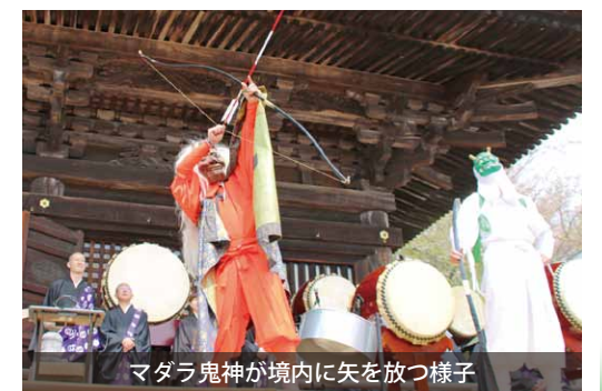
マダラ鬼神が境内に矢を放つ様子

雨引山薬法寺で約370年の歴史を持ち、日本2大鬼祭の一つ「マダラ鬼神祭」が行われました。この祭りは、14世紀末に同寺が戦火で焼失した時、マダラ鬼神が馬で現れ、大勢の鬼たちを指図し7日7夜で再建したという言い伝えによるものです。祭りは、鬼神と鬼たちが柴燈護摩のたかれる炎の周りで鬼踊りを披露し、最後に破魔矢を境内に放ちます。