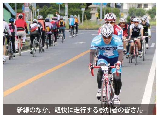
新緑のなか、軽快に走行する参加者の皆さん

ツール・ド・さくらがわ実行委員会主催の「2016 ツール・ド・さくらがわ」が、近隣市町を含む桜川市周辺で、開催されました。当日は約520人が参加。新緑のなか、山岳コースや市内散策コースなどを楽しみながら走りまわりました。毎年参加している参加者は、「今年も楽しく走りまわりました。来年も参加します」と話していました。