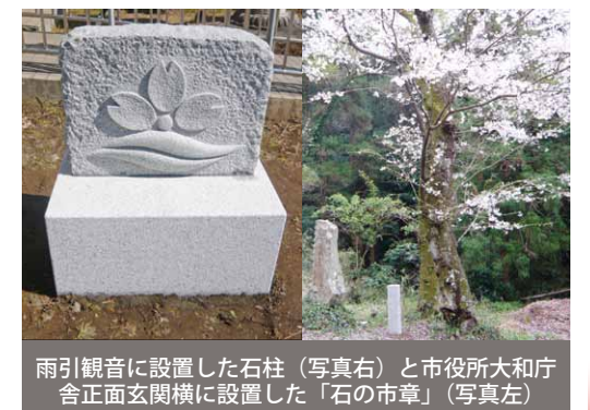
雨引観音に設置した石柱（写真右）と市役所大和庁舎正面玄関横に設置した「石の市章」（写真左）

桜川市商工会が、平成27年度「第25回桜川市大和の石まつり」で製作された石柱を、雨引山など市内9か所の桜の名所に設置しました。この石柱は、桜川市制施行10周年を記念して、会場に來場した皆さんが少しずつ刻んで作り上げたもので、名所の名前が刻まれています。あわせて真壁の伝統工芸士が作成した「石の市章」も市役所大和庁舎に設置しました。