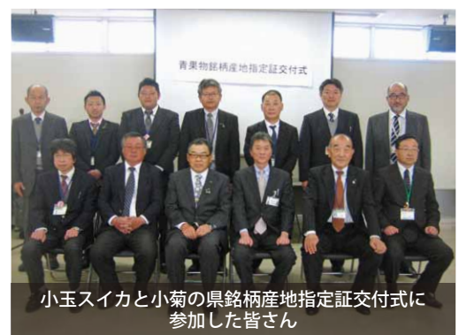
小玉スイカと小菊の県銘柄産地指定証交付式に参加した皆さん

J A北つくば管内の桜川市と筑西市で生産されている小玉スイカと小菊が、茨城県から県を代表する産地として、銘柄産地の再指定を受けました。銘柄産地指定証交付式当日は、J A北つくばや桜川・筑西市から関係者が集まり、県から各市へ指定証が交付されました。今後は、産地の維持発展やニーズに対応できる技術確立を進めていきます。