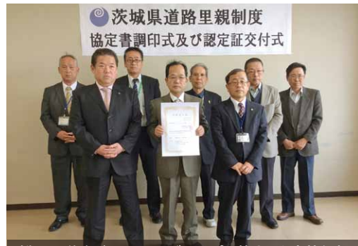
鉾田区道路ボランティアグループの皆さんと市執行部