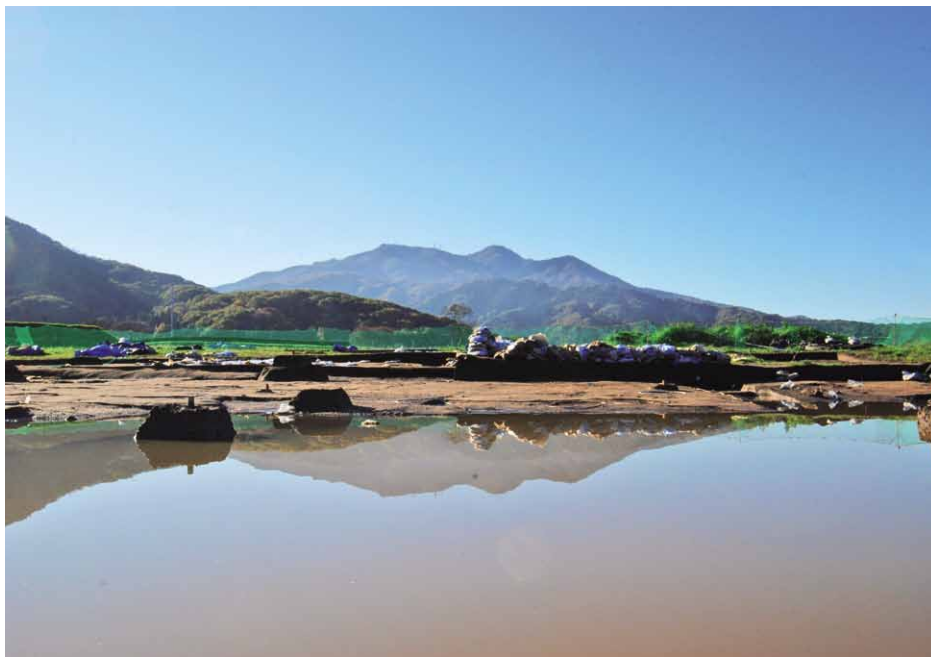
真壁城跡「中城庭園」で出土した北池と筑波山のような北池は、雨が降ると水が溜まり、池が復元されました。水面には筑波山が映ります。 所在地：桜川市真壁町古城字中城 地内（真壁体育館 東側）