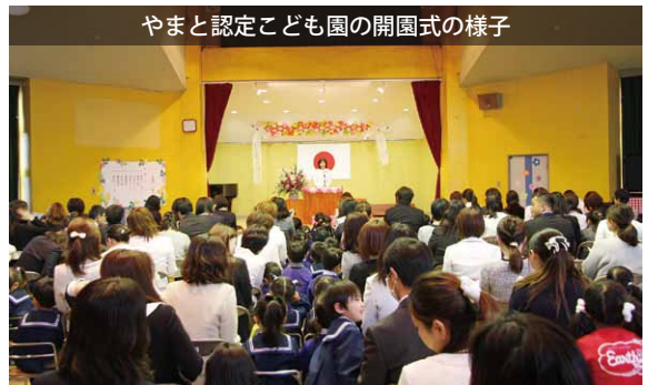
やまと認定こども園の開園式の様子

岩瀬認定こども園（岩瀬保育所・坂戸幼稚園）、岩瀬東部認定こども園（岩瀬東部保育所・岩瀬北部保育所）、やまと認定こども園（やまと保育所・やまと幼稚園）の3園が一齐に開園し、それぞれ開園式と入園式を行いました。