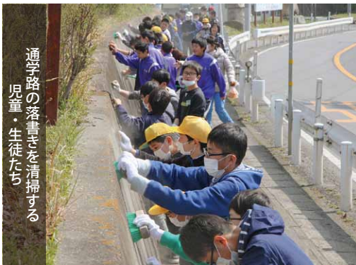
通学路の落書きを清掃する児童・生徒たち

これは、小中連携の一環として、通学路整備と小中学校の交流を目的に実施。当日は、マスクや軍手を身に着けた児童・生徒約100人が、タワシやブラシなどを使って落書きを消しました。