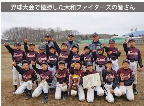
野球大会で優勝した大和ファイターズの皆さん