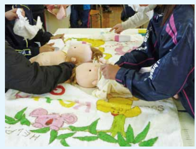
赤ちゃん人形を使ったお世話を体験する児童生徒たち

小中学生向けに 思春期教育を実施 健康推進課では、定期的に、市内の小中学校で思春期教育を行っています。 これは、児童生徒に、赤ちゃん人形でのお世話体験(おむつ交換、抱っこなど)や妊婦ジャケットを使った妊婦さん体験を通して、命の大切さを学んでもらうものです。 参加した児童生徒からは、「赤ちゃんが思ったより重かった」「妊婦さんがすごく大変なことが分かった」などの感想をいただいています。