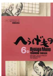
古田織部の漫画「へうげもの」真壁図書館にあります。

真壁城跡（国史跡）は、中世の真壁氏の城跡です。桜川市では、真壁城跡をわかりやすく復元し、活用するため、史跡真壁城跡保存整備事業を実施しています。これまでの発掘では、中城（三の丸）の中心部に、安土桃山時代の「中城庭園」が出土しました。安土桃山時代といえ、豊臣秀吉、千利休、古田織部などが活躍し、茶室や露地による新たな庭園文化が発展した時代です。中城庭園は、2つの池を中心に、飛石や砂敷き道などの露地、茶室、御殿、能舞台などを備えた広大な庭園です。今後、中城地区の発掘成果や復元計画について、皆様にご紹介します。