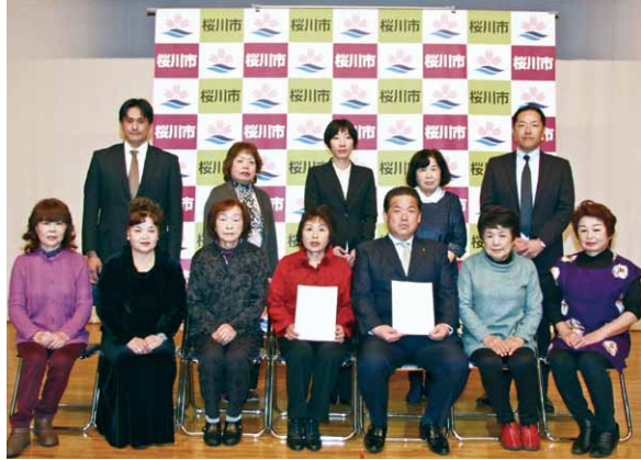
新たに協定を交わした事業所の皆さん