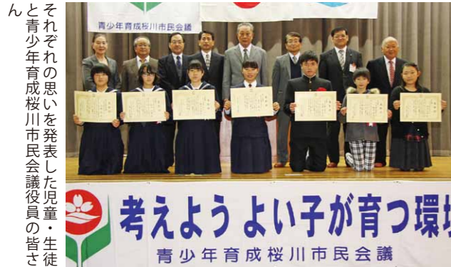
それぞれの思いを発表した児童・生徒と青少年育成桜川市民会議役員の皆さん

桃山中学校で、青少年育成桜川市民会議主催の「第10回桜川市青少年の主張大会」が開催されました。 本大会は、青少年が自ら社会の一員としての自覚と責任感に目覚め、健康な心身づくりに努めること、日常生活の中で感じたことを社会に訴え、それを青少年の育成活動に反映させることを目的としたものです。 当日は真壁小と紫尾小学校、市内5つの中学校から選出された児童・生徒7人が「かけがえない時間」「夢のままでは終わらせない」など様々なテーマで、思い思いの主張を発表しました。