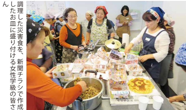
調理した災害食を、新聞チラシで作成したお皿に盛り付けている女性学級の皆さん

女性リーダーの育成を目的とする桜川市女性学級の学習会が、真壁伝承館で開催されました。 当日は、市外の災害体験者や災害食研究団体を講師に招き、「ライフラインが寸断される中で作れる献立調理と試食体験」をテーマに、学級生36人が災害食作りに挑戦。長期保存できる缶詰を主な食材として、洗米しないで作る炊き込みご飯、みそ汁、デザートなどを卓上コンロで調理しました。 新聞チラシを利用して作ったお茶碗やお皿に、料理を盛り付けて試食。「とても美味しい」と学級生は満足していました。