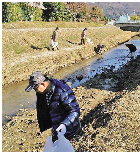
山口川を清掃する真壁のひなまつり実行委員の皆さん

このように、市民が取組み、市民が支える、まさに市民が作る真壁のひなまつり。そんな視点で真壁のひなまつりを見ると、また新たな魅力に気付くのではないのでしょうか。