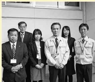
岩瀬庁舎総合窓口課の職員