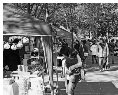
昨年の「森コミいち」の様子

■日時／11月29日（日）10時～15時 雨天決行（荒天中止） ■場所／上野沼やすらぎの里 ■問合せ／森コミいち実行委員会（企画課内）☎581-5111・751-3111代表 表 http://mori-com-1.jimdo.com/ https://www.facebook.com/mori.com.1