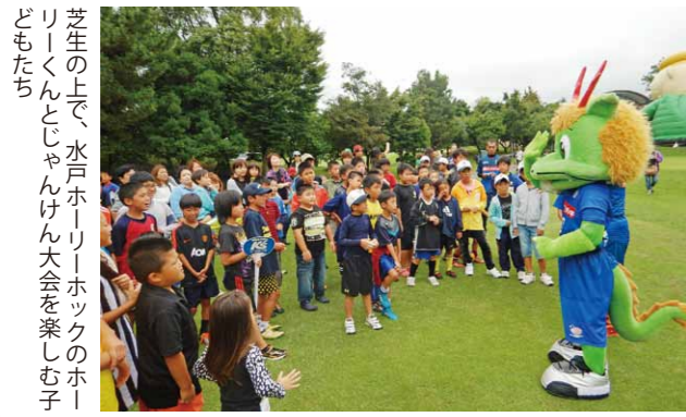
芝生の上で、水戸ホーリーホックのホーリーくんといじゃんけん大会を楽しむ子どもたち

子どもたちがゴルフ場を 利用したイベントを満喫 8月26日 筑西市内のゴルフ場で、桜川市・筑西市在住の小・中学生と保護者を対象に、ゴルフ場とクラブハウスを無料開放する「感謝祭」が行われました。 これは、同ゴルフ場が地域の方へ日頃の感謝を表すとともに、子どもたちにゴルフに親しんでもらおうと開催。芝生を利用したさまざまなイベントが行われ、バーベキューなどが振る舞われました。 当日は、約700人が参加し、パターゴルフなどのイベントのほか、サッカーJ2水戸ホーリーホックによるサッカー教室、じゃんけん大会などを楽しみました。