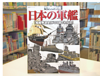
CG大図鑑 日本の軍艦 有限会社オフィス五稜郭 編

貸出期間 ▼ 2週間(資料合計:1人10冊まで) 開放時間 ▼ 平日10時~18時 土日曜日9時~17時 休館日 ▼ 月曜日・祝日 問合せ先 ▼ ☎0296-2318555