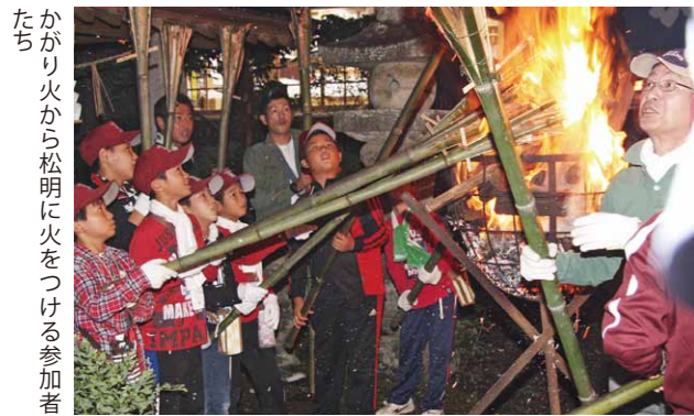
かがり火から松明に火をつける参加者たち

8月31日 五穀豊穣を祈願 「かつたて祭り」 桜川市真壁地区の五所駒瀧神社で、真壁に夏の終わりを告げる風物詩「かつたて祭り」が行われ、五穀豊穣を祈願しました。当日は、氏子や地元住民、スポーツ少年団など約130人が五所駒瀧神社に集まり、ご祈祷後、松明に火を灯し、権現山の登山道を一列になって登りました。中腹にある祠に到着すると松明を立て、神火を奉献しました。 この祭りでは、地元住民の方が協力して登山道や祠周辺の木の剪定を行ったり、真壁高校の生徒が参加したりするなど、伝統行事を継承する取り組みが行われました。