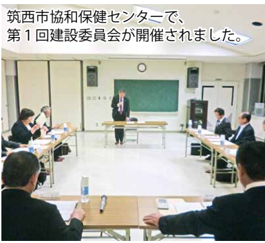
筑西市協和保健センターで、第1回建設委員会が開催されました。