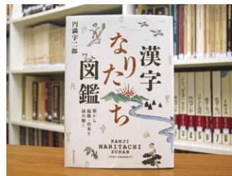
漢字なりたち図鑑 形から起源・由来を読み解く 円満字二郎 著

貸出期間 ▼ 2週間(1人5冊まで) 開放時間 ▼ 9時~17時 休館日 ▼ 月曜日・祝日 問合せ先 ▼ ☎0296-7510344