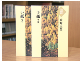
手紙 (大活字本シリーズ)上・下 東野圭吾 著

貸出期間 ▼ 2週間(1人5冊まで) 開放時間 ▼ 9時~17時 休館日 ▼ 月曜日・祝日 問合せ先 ▼ ☎0296-5817117