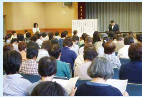
健康推進員会連絡会議

今春、健康推進員にアンケート調査をしたところ、「自身の健康・家族の健康そして地域の健康について考えるようになった。」「健康づくり情報を見るようになった。」などの意見が多く寄せられました。