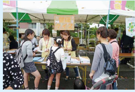
市民祭の健康クイズコーナー

9月27日に行われた市制施行10周年記念桜川市民祭の健康まつりでは、「健康クイズ」を行い、多くの方にクイズに