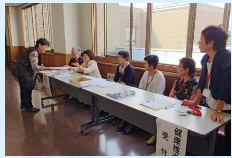
市民健康講座の受付