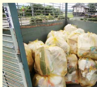
全世帯がきちんと指定袋でごみを出している集積所（本郷地区）