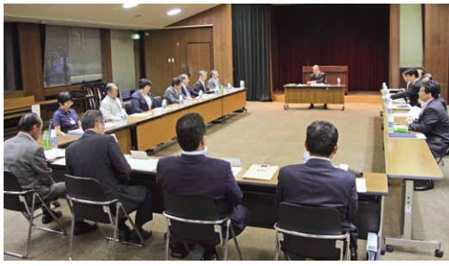
筑西・桜川地域公立病院等再編整備推進協議会が開催され、意見が交わされました。

新中核病院および桜川市立病院を合わせた必要病床数のピークは平成42年で、最大452床、最小313床と推