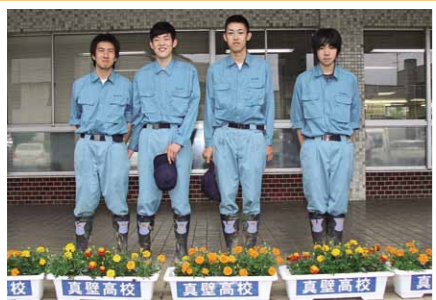
市役所大和庁舎へパンジーを届けた真壁高校生の皆さん

真壁高校から、農業科草花コース2・3年生21人が育てたマリーゴールドの花が寄贈され、市役所各庁舎や真壁伝承館などに飾られています。