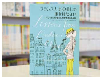
フランス人は10着しか服を持たない ジェニファー・L・スコット 著/神崎朗子 訳

貸出期間 ▼ 2週間(資料合計:1人10冊まで) 開放時間 ▼ 平日10時~18時 土・日曜日9時~17時 休館日 ▼ 月曜日・祝日 問合せ先 ▼ ☎0296-2318525