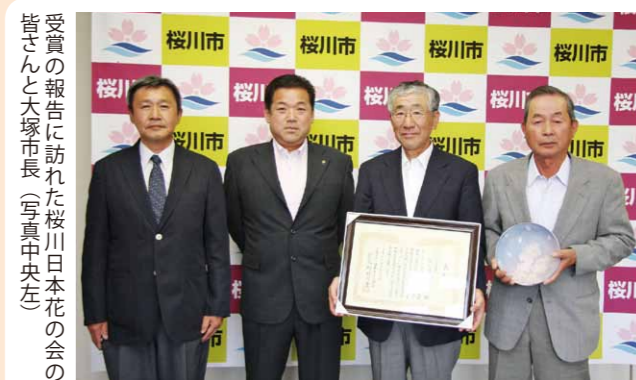
受賞の報告に訪れた桜川日本花の会の皆さんと大塚市長（写真中央左）