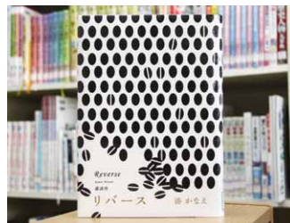
リバース 湊 かなえ 著

貸出期間 ▼ 2週間(1人5冊まで) 開放時間 ▼ 9時~17時 休館日 ▼ 月曜日・祝日 問合せ先 ▼ ☎0296-7510344