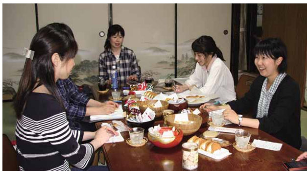
活発な意見が交わされる桜川本物づくり委員会女子会

今は、日々酒蔵の仕事を学びながら、まちづくり団体「桜川本物づくり委員会」に加わり、多くの仲間と囲まれて真壁の良さをいかしたイベントの企画などを行っています。 地元では気づかない視点をもち、地域の良さを見つめることができる良い意味での「よそ者」の存在が加わり、真壁のまちづくりの今後の展開がますます楽しみです。