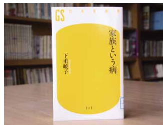
家族という病 下重暁子 著

貸出期間 ▼ 2週間(1人5冊まで) 開放時間 ▼ 9時~17時 休館日 ▼ 月曜日・祝日 問合せ先 ▼ ☎0296-5817117