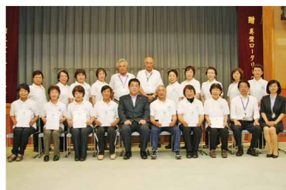
県から感謝状を受賞されたシルバリーハビリー体操指導士と関係者の皆さん

公益社団法人日本さくらの会主催第50回さくら祭り中央大会で、功労者表彰が行われ、さくら功労者として、本市の桜川日本花の会が表彰されました。 これは、桜の保護、植栽、品種の収集保存や普及を目的とする日本さくらの会の事業に貢献した団体などを表彰するもので、桜川日本花の会による、歴史ある市内の桜の生態保護活動や近隣学校への課外学習活動などの日々の功績が認められました。 受賞された皆さんは、「大切な桜を守るため、今後も力を合わせて頑張っていきたい」と話していました。