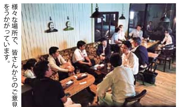
様々な場所で、皆さんからのご意見をうかがっています。

本市では現在、地域の持つ特性を生かし、「しごと」をつくり、「ひと」を呼び込み、活力ある「まち」を目指し、「(仮称)桜川市まち・ひと・しごと創生総合戦略」の策定に取り組んでいます。 策定にあたっては、従来の行政主導ではなく、地域で暮らす皆さんとともに未来を考えながら進めていきます。そこで、幅広く市民の皆さんの声を聞くため、各地区や各種団体などを中心にヒアリング調査を実施していきます。