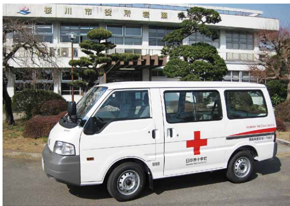
日本赤十字社茨城支部が桜川市地区分区に配備した災害救援車両

日本赤十字社茨城支部が 災害救援車両配備 3月30日 日本赤十字社茨城支部が、桜川市地区分区に災害救援車両を配備しました。 これは、災害救援活動や奉仕団などの一般赤十字活動に使用して、各地域の赤十字活動を推進するため、同支部が配備したものです。 今回、桜川市地区分区から配備希望申請を受けた同支部が、配備を決定。同車両は桜川市役所で管理し、火災などの災害が発生したときに、毛布やふとん、ブルーシートなどの救援物資を運ぶなど、様々な災害救援活動で活躍します。