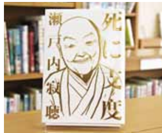
死に支度 瀬戸内寂聴 著

貸出期間 ▼ 2週間(1人5冊まで) 開放時間 ▼ 9時~17時 休館日 ▼ 月曜日・祝日 問合せ先 ▼ ☎0296-5817117