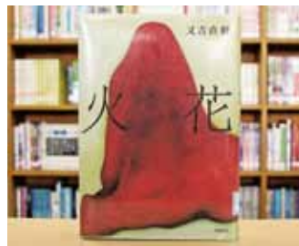
火花 又吉直樹 著

貸出期間 ▼ 2週間(1人5冊まで) 開放時間 ▼ 9時~17時 休館日 ▼ 月曜日・祝日 問合せ先 ▼ ☎0296-7510344