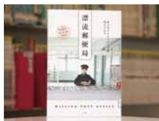
漂流郵便局 届け先のわからない手紙、預かります 久保田沙耶 著

貸出期間 ▼ 2週間(資料合計: 1人10冊まで) 開放時間 ▼ 平日10時~18時 土・日曜日9時~17時 休館日 ▼ 月曜日・祝日 問合せ先 ▼ ☎0296-2318525