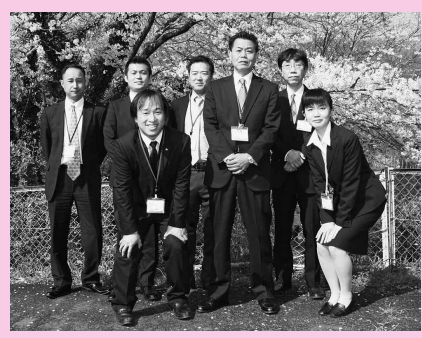
総合戦略室の職員