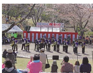
名勝「桜川」の桜まつり。国の天然記念物に指定されている桜もあります。

このような状況下、更なるイベントや観光宣伝の強化を図り、各方面からの観光客が訪れやすい誘導策を講じる方策を検討してまいります。