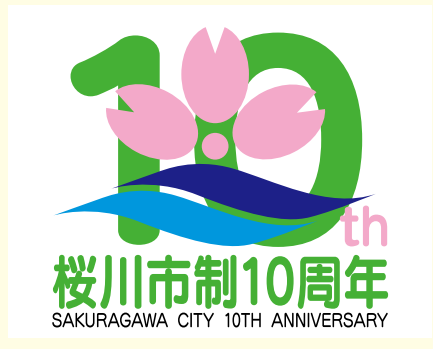
10周年を記念して作成したロゴマーク