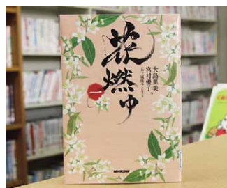
花燃ゆ 一 大島里美・宮村優子 作

貸出期間 ▼ 2週間(1人5冊まで) 開放時間 ▼ 9時~17時 休館日 ▼ 月曜日・祝日 問合せ先 ▼ ☎0296-7510344