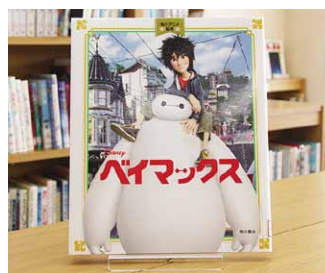
ベイマックス 角川アニメ絵本

貸出期間 ▼ 2週間(1人5冊まで) 開放時間 ▼ 9時~17時 休館日 ▼ 月曜日・祝日 問合せ先 ▼ ☎0296-5817117