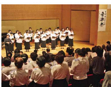
市民文化祭音楽祭を開催。日ごろの練習の成果を発表しました。

講座・イベントを開催し、市民の皆様の学習・文化活動に対する意識啓発を図るとともに、市民が主体となって行う芸術文化活動の成果発表などを支援してまいります。