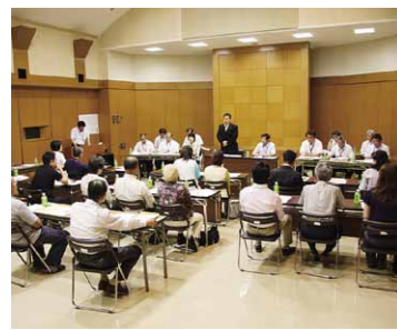
市政モニター会議。モニターの皆様のご意見を市政に取り入れていきます。

次に、地方財政計画が細部にわたり確定を見るに至ってはおりませんが、平成26年度に引き続き、大変厳しい状況での予算編成となりましたが、地域主権のもとでの国・県補助金を有効に活用し、予算を組むことが出来ました。今後も、行財政改革を推進し、徹底した経費の削減と創意工夫を図り、市民の皆様が安心・安全に暮らせるような市政運営に努めてまいります。