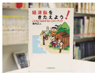
経済脳をきたえよう! こどもにもわかるレクソンブック 池内正人 著

貸出期間 ▼ 2週間(資料合計:1人10冊まで) 開放時間 ▼ 平日10時~18時 土曜日9時~17時 休館日 ▼ 月曜日・祝日 問合せ先 ▼ ☎0296-2318525