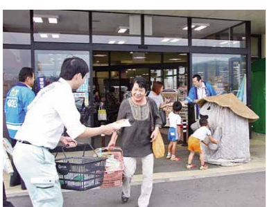
下水道の普及のため、市内で下水道接続促進キャンペーンを行いました。