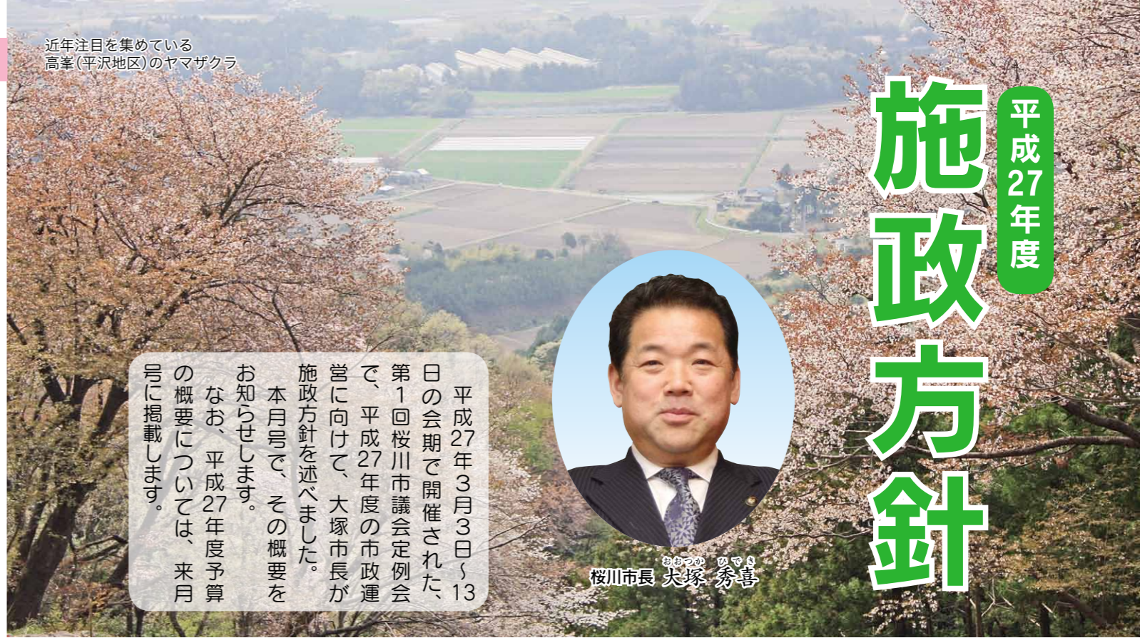
近年注目を集めている高峯(平沢地区)のヤマザクラ