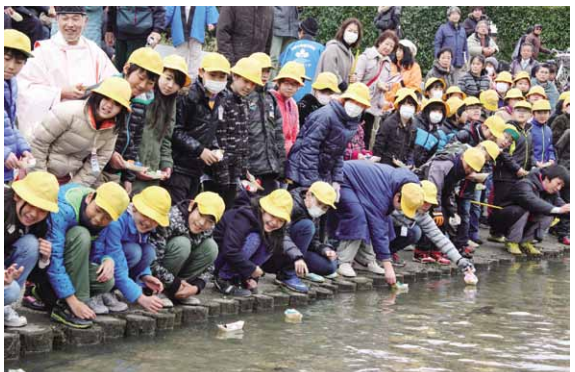
成長を祈り、川にひな人形を流す真壁小学校児童たち

真壁のひなまつり最終日に和の風流し雛が行われ、当時真壁小学校5年生89人などが、折り紙で作ったひな人形を小舟に乗せ、真壁市街地を流れる山口川に流しました。これは、市民有志の皆さんと真壁小学校が、真壁のひなまつりのフィナーレに心を込めて子どもたちの成長を祈りたいと、毎年行っているものです。当日は、五所駒瀧神社宮司のご祈祷後、児童たちが自分で作ったひな人形を川に浮かべました。また、一般の方も、真壁街並み案内ボランティアの皆さんが作って配ったひな人形に、願いを込めて流しました。