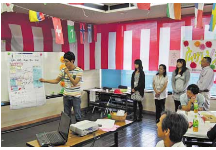
参加した皆さんは、真剣な眼差しで討議と発表を行いました。

当日は20代から60代までの市民の皆さん20人が参加し、「もっとステツプアップさくらがわ」をテーマに、桜川市