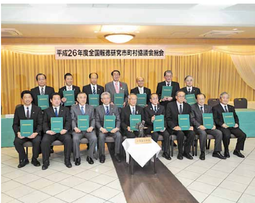
災害時応援協定締結式の様子

前日の総会には市長が出席し、加盟17市町村が災害時相互応援協定に調印しました。広域災害においては、遠方の市町村との応援関係が重要です。桜川市としても、将来の災害に備えて協力体制を深めてゆきます。