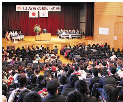
新成人447人が参加した「桜川市はたちの集い」

この式は、大人になったことを自覚し、社会の一員として責任をもって未来の夢に向かって大きくはばたくこととする新成人をお祝いするもので、市の新成人は、男性274人、女性268人の計542人でした。当日は、447人が式に参加