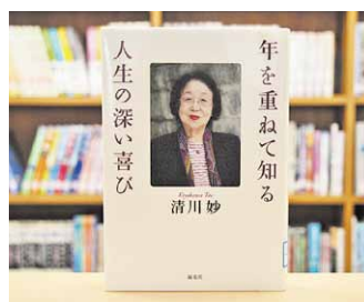
年を重ねて知る人生の深い喜び 清川 妙 著

貸出期間 ▼ 2週間(1人5冊まで) 開放時間 ▼ 9時~17時 休館日 ▼ 月曜日・祝日 問合せ先 ▼ ☎0296-7510344