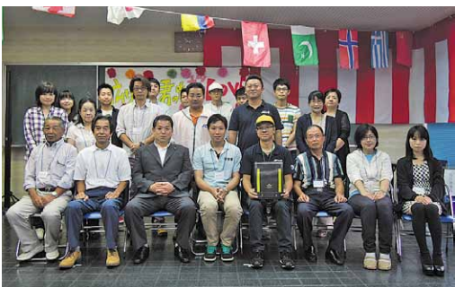
第3回さくらがわ市民討議会に参加した皆さん

12月19日には報告会も開催され、皆さんの意見の詰まった報告書が市長へ手渡されました。