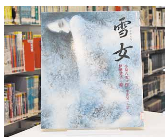
雪女 小泉八雲 作/平井呈一 訳 伊勢英子 絵

貸出期間 ▼ 2週間(資料合計:1人10冊まで) 開放時間 ▼ 平日10時~18時 土日曜日9時~17時 休館日 ▼ 月曜日・祝日 問合せ先 ▼ ☎0296-2318525