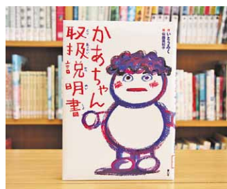
かあちゃん取扱説明書 いとうみく 作/佐藤真紀子 絵

貸出期間 ▼ 2週間(1人5冊まで) 開放時間 ▼ 9時~17時 休館日 ▼ 月曜日・祝日 問合せ先 ▼ ☎0296-5817117