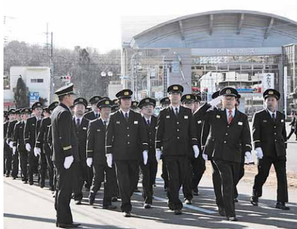
式典最後には、関係者および消防車両が参加して勇壮な分列行進が行われました。

終了後、37分団の勇壮な分列行進と地域の安全を祈願した一斉放水が、上野沼（岩瀬地区）・精進沼（大和地区）・つくし湖（真壁地区）の3か所に分かれて行われました。