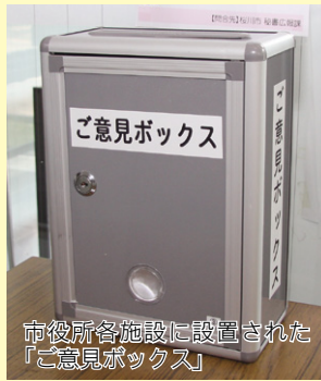
市役所各施設に設置された「ご意見ボックス」

職員への対応やサービスについて、皆様のご意見をぜひ「ご意見ボックス」へお寄せください