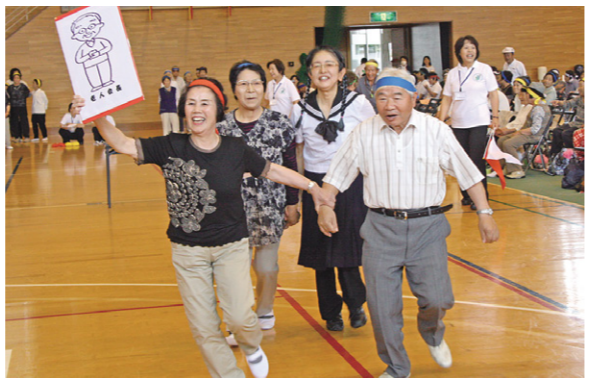
ユニークな「借り人競走」を行う参加者の皆さん

6月26日、岩瀬体育館「ラスカ」で、社会福祉協議会主催の「生きいき大運動会」が開催され、生きいきサロン利用者やボランティアの方など214人が参加しました。 生きいきサロンは、高齢者の仲間づくりや健康維持・介護予防を目的に、月1・2回、地域の集落センターなどで開催されています。 当日は、ボール運びや借り人競走、紅白玉入れなどのユニークな競技やアトラクションなど、参加者の皆さんは楽しく体を動かして、親睦を深めました。