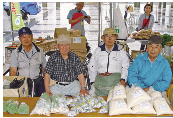
墨田区と桜川市の友好交流の一環として「すみだ環境フェア2014」に参加した「真壁野菜づくりの会」の皆さん

6月28・29日の両日、東京都墨田区が主催する「すみだ環境フェア2014」で、「真壁野菜づくりの会」の皆さんが、地元桜川市産の採れたて新鮮野菜を販売しました。 この同会の野菜販売は、「全国の赤穂義士ゆかりの市町で構成する「忠臣蔵サミット」がきっかけとなり、墨田区と桜川市の友好交流の一環として平成5年から始まったもので、毎月第2・4土曜日に墨田区役所敷地で販売が行われているなど、長年にわたる「桜川市産野菜」のPRに一役買っています。