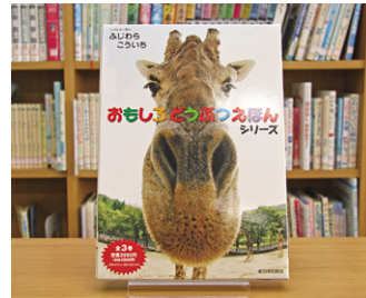
おもしろどうぶつ えほんシリーズ ふじわらこういち しゃしん/ぶん

貸出期間 ▼ 2週間(1人5冊まで) 開放時間 ▼ 9時~17時 休館日 ▼ 月曜日・祝日 問合先 ▼ ☎029615817117