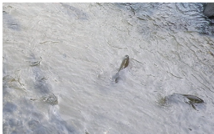
山口川にいる50匹を超える鯉が、エサに集まります。

問合せ／企画課 統計・市民協働グループ (☎58-5111・75-3111代表)