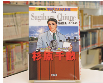
学習まんが人物館 杉原千畝 渡辺 勝正 監修

貸出期間 ▼ 2週間(資料合計:1人10冊まで) 開放時間 ▼ 平日10時~18時 土・日曜日9時~17時 休館日 ▼ 月曜日・祝日 問合先 ▼ ☎029612318525