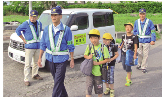
子どもたちの登下校を見守る榊穂防犯パトロール隊

市内では、総勢371名で構成される防犯連絡員、17団体の防犯ボランティア団体の皆さんの協力により定期的に防犯パトロールが実施され、平成25年の犯罪発生件数は350件と県内でも低い水準を保っています。 しかし、自動車盗難が市内で37件発生するなど防犯体制の強化は必要不可欠になっています。 今後とも警察の力だけでなく、「自分たちの地域は自分たちで守る」という意識で、安全で安心なまちづくりを目指す必要があります。