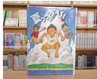
夏っ飛び 横山 充男 作/ よこやまようへい 絵

貸出期間 ▼ 2週間(1人5冊まで) 開放時間 ▼ 9時~17時 休館日 ▼ 月曜日・祝日 問合先 ▼ ☎029617510344