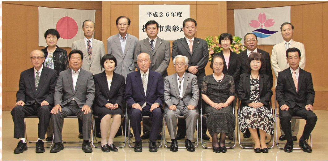
「桜川市表彰式」に出席された皆さん

7月8日に市役所大和庁舎で、「桜川市表彰式」が開催され、桜川市表彰条例に基づき、市の政治・文化・社会・経済・その他地方自治の各般にわたってその発展に貢献し、他の模範と認められた方を表彰しました。